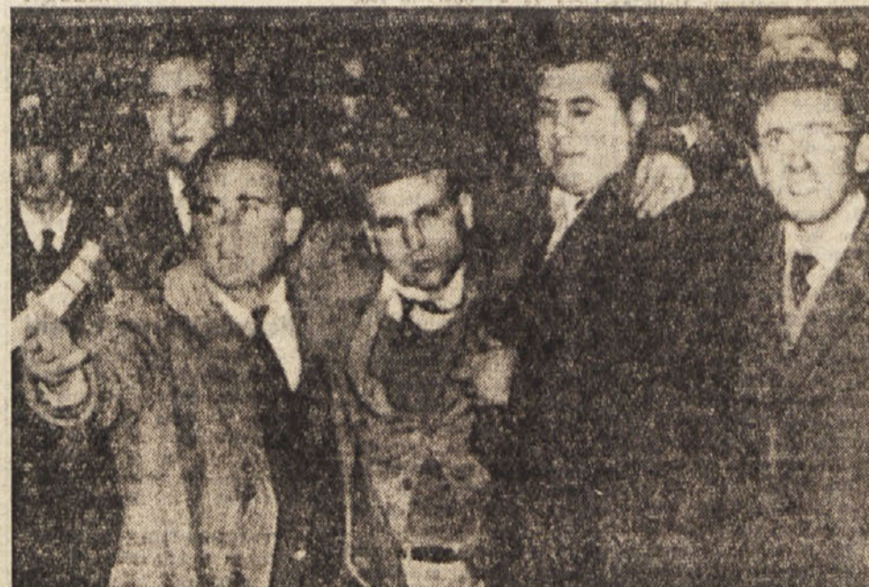
V zadnjih dneh je življenje italijanskih visokošolcev zelo razgibano...