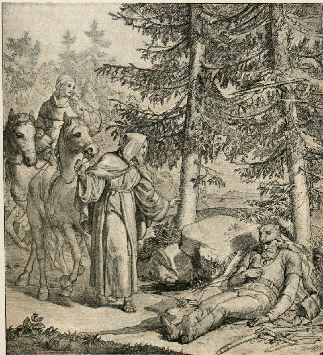
SMRT KRALJEVIČA MARKA.

Vrnil se je v svoje stanovanje. Tu ga je čakalo na mizi pismo. Zapisano je bilo, da nastopi mesto koncipienta lahko takoj, in njegova radost je bila popolna. Odpotovati