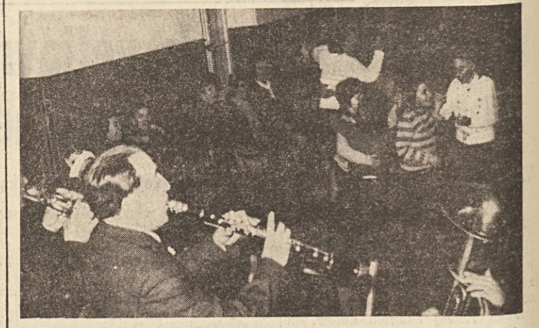
Mednarodni praznik žena, 8. marec, so te dni slavili še v Trebičah in na Opčinah, kar kažeeta gornja in spodnja slika