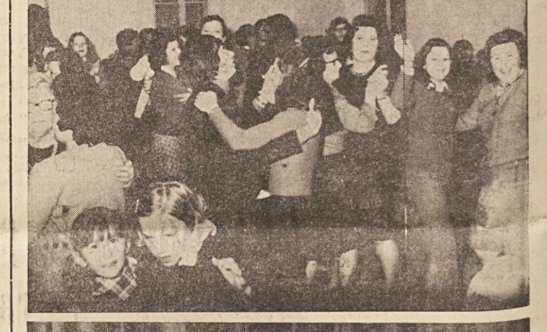
Ricmanjski otroci, ki so sodelovali na proslavi, o kateri poročamo tu in v spodnjem poročilu