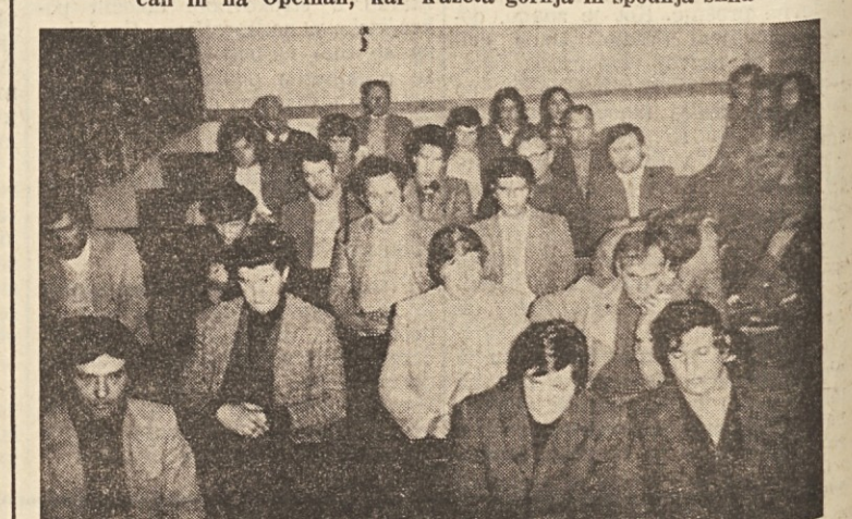
Pa tudi v PD «škamperle» pri Sv. Ivanu in pri Domju, kot kažeeta sliki zgoraj in spodaj