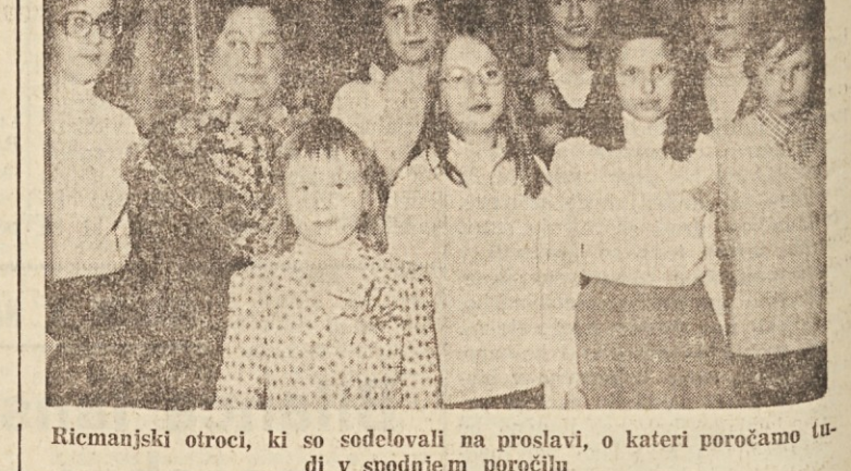
Ricmanjski otroci, ki so sodelovali na proslavi, o kateri poročamo tu in v spodnjem poročilu