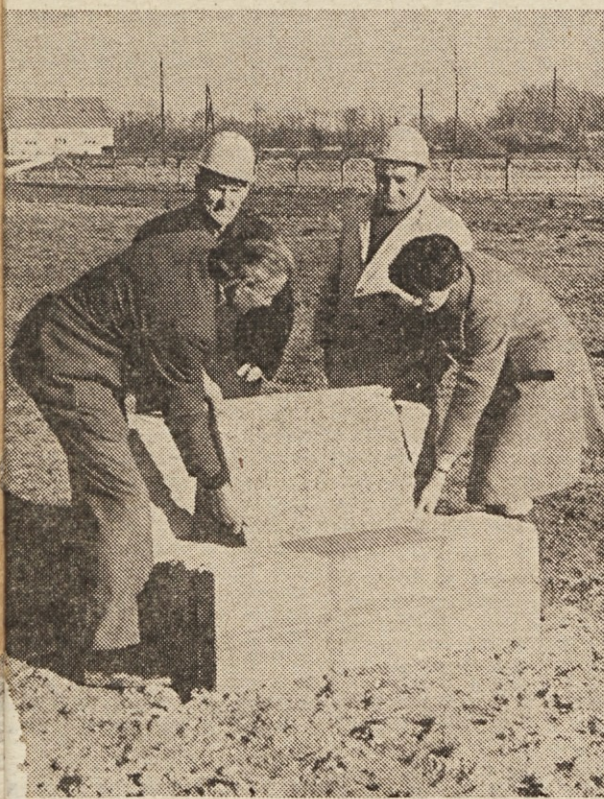
veci iz Razkrižja polagajo temeljno ploščo za nov pre- delovalni obrat.

»Ze tedaj, ko je Emona — še ex Prehrana — sprejela sklep, da ustanovi svojo od- nadaljevanje na 2. strani