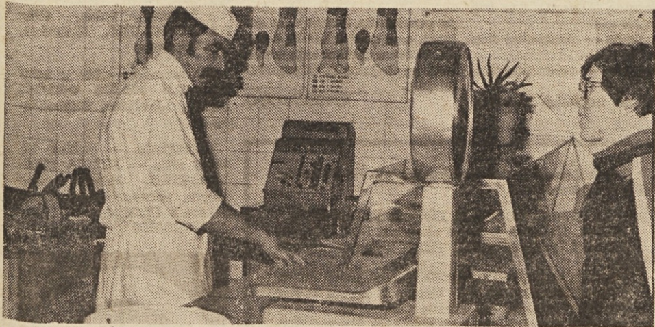
Pri mesarju v Savskem naselju je točnost doma.