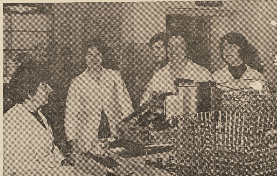
Vodiška dekleta so bila sicer sramežljiva, vendar nad vse vesela, da smo se spomnili tudi nanje — Še pridemo, če nas povabite.

V Vodichah za Šmarno goro. Naš market, ki se je naselil v nekdanji zadrugi dom, je eden tistih podeželskih, v katerem dobite domala vse, saj tudi kmetje dandanašnji kupujejo v trgovinah vse od kurje piče in kruha do solate. Če verjamete ali ne. Prav zaradi tega in pa dinarja, ki