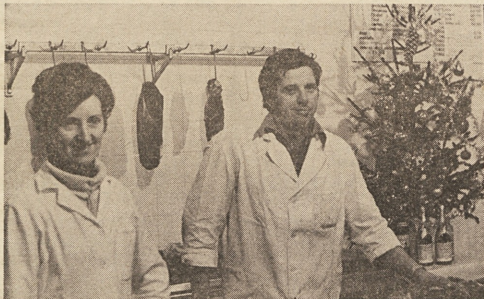
Tudi sežanski market sodi med tiste, ki so lahko za vzgled drugim, tako kar zadeva ljubeznivost kot ponudbo.

li vstan svoj pošteno prisluženi dinar... Gosta in kvalitetno prepletena pajčevina na tistem zgornjem straniščnem oknu po »letnicah sodeč dokazuje, da ta trgovska hiša ni odprta od véera... je čistilka nagrajevana po učinku ali na uro? Kdo je odmontiral drugi pisar na moškem WC, še ni razčiščeno.