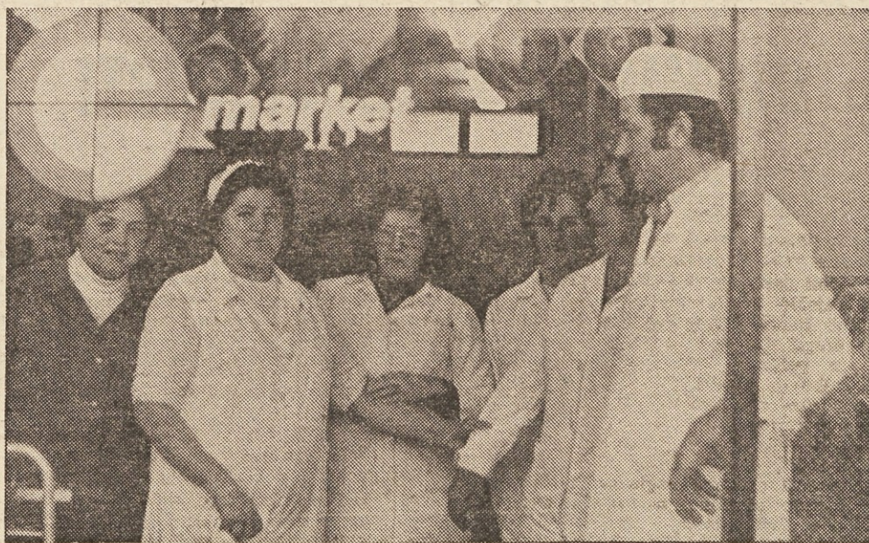
V Škofjeloškem marketu smo bili kot potrošniki deležni nevsakdanje pozornosti, le bife se ni ravno izkazal.

»Pepelnikov sem že toliko kupila, da ne mislim nobene več«, nama je zaupala natakarka za točilno mizo, ko smo nekaj robantili čez arhivsko izdelane pepelnike iz prvih časov, ko smo te »pode« začeli uporabljati pri nas tudi v javnosti.