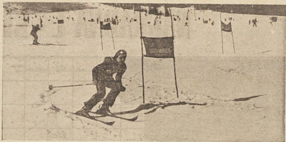
Tudi letos bo boj za sekunde.

Tako kot dosedaj, bo tudi letos prog postavljena tako, da nastopajočim ne bo delala večjih težav, saj je namen našega tekmovanja predvsem množičnost. Pričakujemo, da se bo tekmovanja udeležilo čimveč naših smučarjev. Vabimo seveda tudi navijače, saj prav oni prispevajo velik delež k prijetnemu tekmovalnemu vzdušju. Po možnosti naj sindikalne organizacije organizirajo na dan tekmovanja v Kranjsko goro izlet za svoje člane — nesmučarje, ki bodo morda