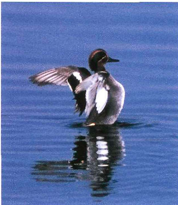
Anas crecca.

P ozimi reka in gozd spremenita svoj obraz. Kljub temu pa