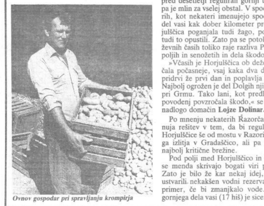
Ornov gospodar pri spraviljanju krompirja

Marsikaj voznik, ki je peljal skozi Razore pri Dobrovi, si bo za vselej zapomnil to vas. Ozki most čez Horjulščico na samem robu vasi, za njim pa še nepregledno razpotje, kjer se stranska cesta odcepi proti Brezovici, sta prava past za neprevidevne voznike, zato ni nič čudnega, da je tu prišlo že do kopice prometnih nesreč. Svoje k temu vsekaror