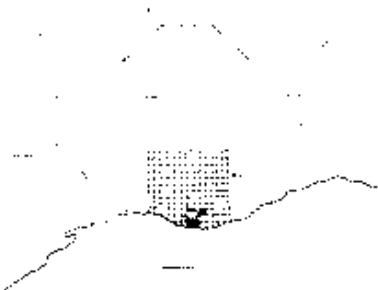
Slika 1: Shema organizacije španskega kolonialnega mesta Buenos Aires. Organisational scheme of the Spanish colonial city Buenos Aires.

Po izboru lokacije naj bi načrt mesta izhajal iz opredelitve prostora za trge, predvsem položaj glavnega trga (»Plaza Mayor«), ceste in parcele. Načrt je nastajal v obliki šahovnice, središče je bil glavni trg, iz katerega so izhajale vse ceste do