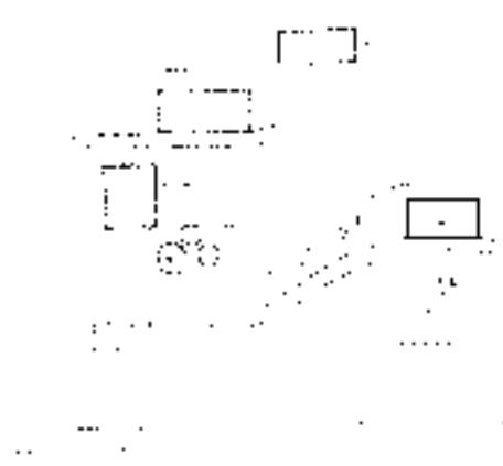
Slika 2: Shema organizacije »estancie«. Organisational scheme of an »estancia«.