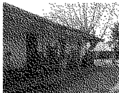
Slika 3: "Chacra", manjša posest v bližini mesta. "Chacra", small property near the city.