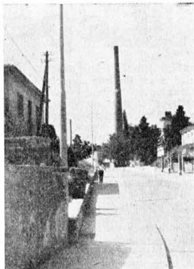
Pot v obrat Argo

3. V vseh strokovnih pisarnah. Tu naj bi bili predvsem taki podatki, ki se nanašajo na določene strokovne službe.