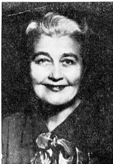
Naša krušna mati v Lepeni

Nepopisna barva šestdeset metrov globokega, sto metrov širokega in dve sto petdeset metrov dolgega Krnskega jezera, polnega osem centimetrov dolgih ribic, človeka prevzame, da pozabi na tisti liter znojca, ki mu ga je izcedilo vroče sonce, preden je vse to videl.