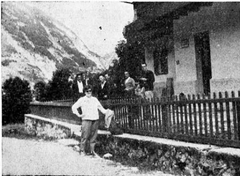
Gostje pred domom v Lepeni

S to številko odpiramo novo rubriko z naslovom PREDLOGI IN MNENJA. Zelim, da bi se v tej rubriki oglašali vsi člani kolektiva, ki imajo kakršenkoli predlog ali pripombo, koristno za izboljšanje poslovanja v podjetju. Prispevki so lahko zelo kratki, v nekaj vrstah. Lahko imajo obširnejšo razlago, lahko so brez nje. Važno je, da v tej rubriki omogočimo publikacijo vrsti koristnih predlogov, ki jih ima marsikdo med nami, pa ne najde priložnosti, da bi jih objavil.