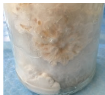
Slika 1: Rast micelija na substratu (papirniški mulj) Figure 1: Growth of mycelium on the substrate

Določanje suhe snovi substrata je bil v skladu s standardom SIST EN 14346: 2007 in celotni organski ogljik (TOC) v skladu s standardom SIST EN 13137: 2002. Vsebnost težkih kovin smo določili po naslednjih standardih: Cu, DIN 38406-E7-2: 1991; Zn, SIST ISO 8288: 1996; Ni, DIN 38406-E11-2: 1991; Cd, SIST EN ISO 5961: 1996; Hg, SIST ISO 5666: 2000; Cr, SIST ISO 9174: 1999; Pb, DIN 38406-E6-2: 1998. Vsebnost celuloze smo določili po Kürschner et al. [15], vsebnost hemiceluloz po Wise in Karl [16] in vsebnost lignina po Fukushima et al. [17].