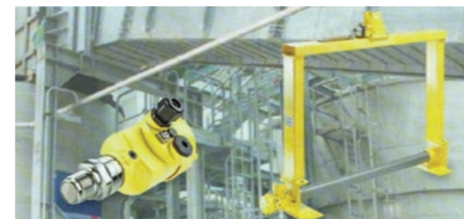
Slika 2: Radarski senzor in radiometrični merilni sistem Figure 2: Radar sensor and radiometric measurement system