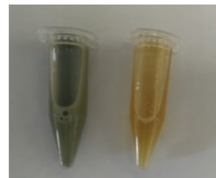
Slika 2: Encimski ekstrakt Figure 2: Enzyme extract

Po ekstrakciji smo vzorce centrifugirali pri 13.200 × g 10 minut pri 4°C. Ugotovljene supernatante smo analizirali za encimske aktivnosti in skupni ekstracelularni protein. Koncentracije beljakovin smo določili z uporabo komponent BCA Protein Assay (Pierce, Rockford, IL, ZDA).