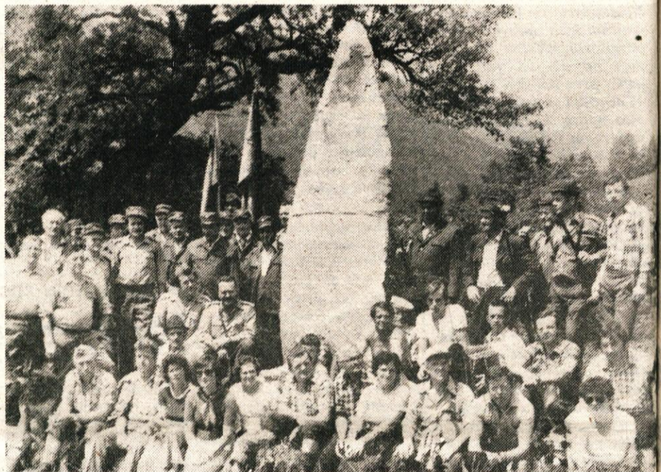
Udeleženci spominskega pohoda ob spomeniku borcem Zidanškove brigade na Slevu

Dolga kolona se je nato pod Županjih njiv spustila v dolino se na drugi strani Kamniške strice povzpela proti Vegri. Tu je bila zaključna prireditev krajevnem prazniku z odkritjem spominske plošče kurirski postojni 7 G, ki je med NOB delala tem območju.