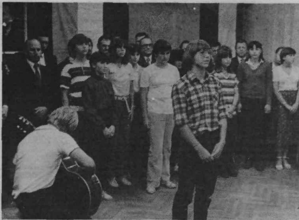
V počastitev 7. septembra, krajevnega praznika Posavja, so potekale številne slovesnosti, prireditve in športna tekmovanja od začetka meseca končale pa se bodo 20. septembra. Osrednja slavnostna proslava je bila v petek, 5. septembra na Šternu (slika), posvečena pa je bila spominskemu dnevu ter pripravljena z bogatim kulturnim sporedom. Praznovanja so se začela v ponedeljek, 1. septembra, s košarkarskim turnirjem krajevnih skupnosti na Igrišču Ježice. V sredo je sledil obhod spominskih obeležij NOB na Posavju, nato strelska tekmovanja ekip krajevnih skupnosti in posameznikov z zračno puško na strelišču SD Tabor Ježice, pa gasilska vaja gasilskih društev Ježice, Stožice in Tomačevca. V soboto so priredili nogometni turnir mladine in košarkarska srečanja mladine na Bratovševi ploščadi, dan kasneje je bil množičen pohod do tabora Rašiške čete, v tem tednu pa bodo pogostili še starejše občane in v soboto organizirali pohod v bojnico Franjo.

Ljubljana, 9. septembra 1980 Leto XX, številka 14 (236)