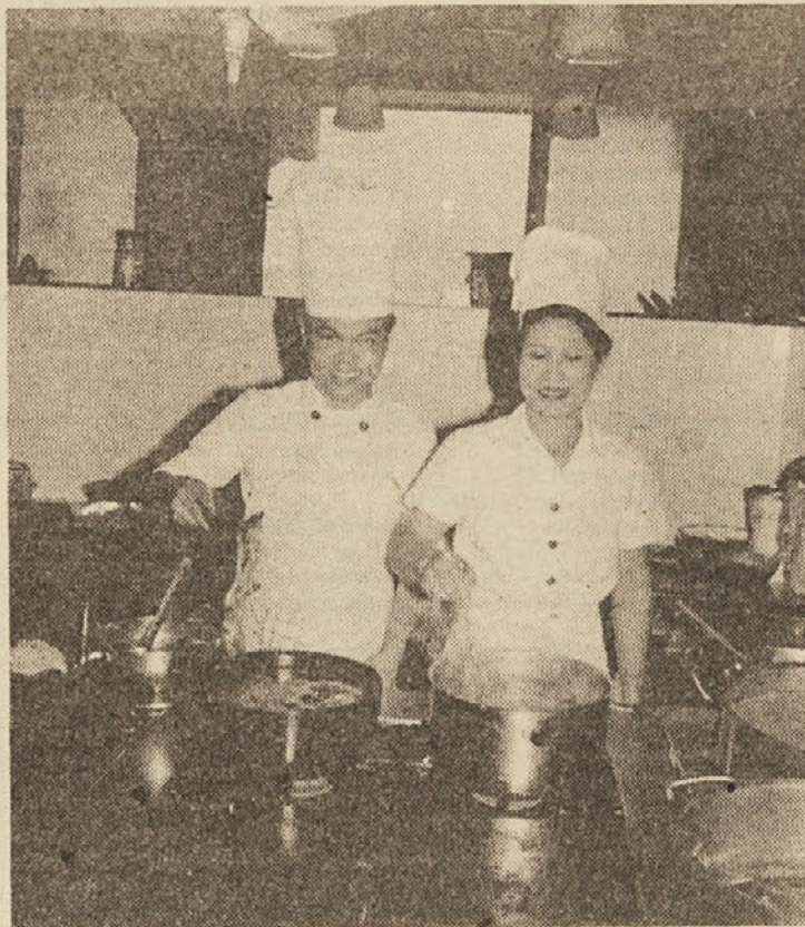
Specialitete bodo vsak čas pripravljene

cem hotela Merx, da s tem tudi nadaljujejo.