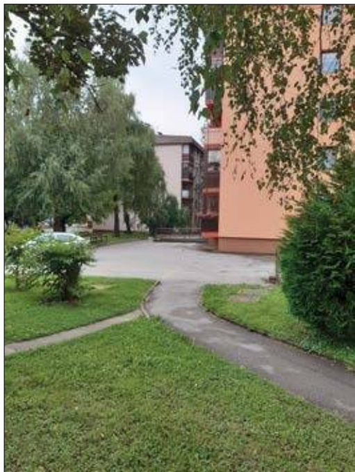
Slika 4: Ustrezno načrtovano sajenje dreves v bližini stavb v mestnem okolju, lahko pripomore k zmanjšanju stroškov ogrevanja ali hlajenja. (foto: M. Brglez Sever)

Urbana vegetacija prispeva k dolgoročnemu delovanju mestnih ekosistemov, ki so za urbane prostoživeče živalske vrste življenjski prostor in vir hrane. Za proces migracij prostoživečih živali v urbanem okolju so pomembne večje gozdne, vodne in zelene površine (Van Druuff in sod., 1995). Urbanizacija lahko privede do ustvarjanja in izboljšanja rastlinskih habitatov, kar posledično povečuje biotsko raznovrstnost. Hkrati so mestni parki lahko rezervoar za ogrožene rastlinske vrste. Vnos novih, tujih rastlinskih vrst v urbana območja lahko povzroči težave pri izpodirvanju avtohtonih vrst. Hkrati lahko spreminjanje vegetacijske strukture v urbanih območjih spremeni razširjenost in pojav novih rastlinskih bolezni in škodljivcev (Nowak in McBride, 1992; Howenstine, 1993).