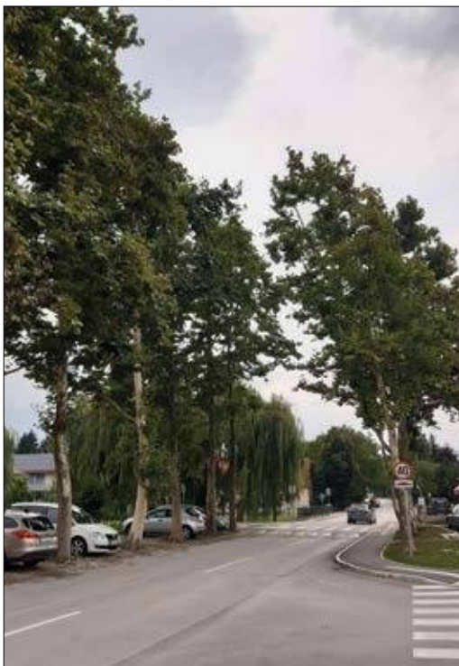
Slika 3: Drevesa ob cestišču so izpostavljena onesnaženju s posipno soljo.

evapotranspiracije, povečanega onesnaževanja zraka ter zmanjšane hitrosti vetra zaradi gradbenih ovir, kar neposredno vpliva na manjše poletno pregrevanje. Z absorpcijo sončnih žarkov drevesa zmanjšajo segrevanje mestnih površin in hkrati pripomorejo k hladnejšemu zraku v poletnih mesecih (Menke in sod., 2013). V neposredni bližini dreves je lahko temperatura zraka od 5 do 15 °C nižja kot na območjih, kjer ni dreves. Drevo v krošnji zadrži 30 % padavin, ki jih prestreže; dodatnih 30 % padavin zadrži s koreninami. Izhlapevanje vode v poletnih mesecih ugodno vpliva na podnebne razmere v mestu. V poletnih mesecih lahko evapotranspiracija pripomore k znižanju temperature zraka od 1 do 5 °C, in sicer samostojno ali v kombinaciji s senčenjem dreves. V urbanem okolju so predvsem ob prometnicah primernejša listopadna drevesa, saj lahko senca dreves iglavcev vpliva na daljšo poledenost prometnih cest (Huang in sod., 1990; Šiftar in sod., 2017). Urbana drevesa lahko vplivajo tudi na ultravijolično sevanje in albedo (Lenschow, 1986).