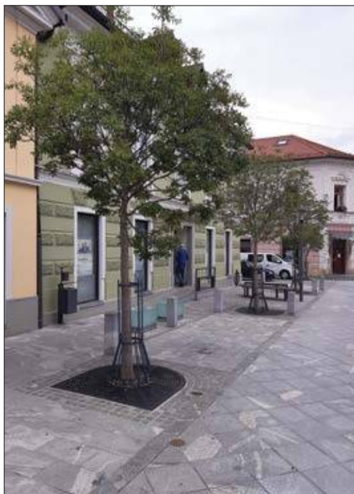
Slika 2: Urbana drevesa se morajo soočiti z zahtevnejšimi ravnimi pogoji kot gozdno drevje.

Glavni vzrok za spremenjene podnebne razmere v urbanih okoljih je spremenjena energijska bilanca, ki je posledica nadomeščanja naravnih zelenih površin in rastlin z zaprtimi površinami in zgradbami (Kuttler, 2008; Kleerekoper in sod., 2012; Doick in Hutchings, 2013). Drevesa v mestnem okolju vplivajo na temperaturo zraka in relativno zračno vlago. V urbanem okolju je nižja relativna zračna vlaga posledica zmanjšane