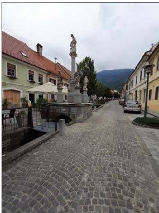
Slika 1: Drevesa v urbanem okolju prispevajo k estetski, ekološki, družbeni, gospodarski in kulturni vrednosti v mestnem okolju. Lokacija: Stari trg, Slov. Konjice.

V urbanih okoljih so drevesa nepogrešljiva stalnica, ki poleg prispevka k ekološki, družbeni in estetski funkciji koristijo tudi kot »orodje« za zmanjševanje posledic že izrazitih podnebnih sprememb. Urbana drevesa pripomorejo k omilitvi učinkov ekstremnih vremenskih pojavov (visoke temperature zraka, dolga sušna obdobja, večji nalivi, močan veter). Hkrati imajo drevesne krošnje sposobnost zmanjšanja učinkov povečane stopnje škodljivega UV-B-sončnega sevanja, količine ozona in drugih škodljivih delcev v zraku (Heisler in sod., 1995; Bavcon in sod., 1999; Šiftar in sod., 2017).