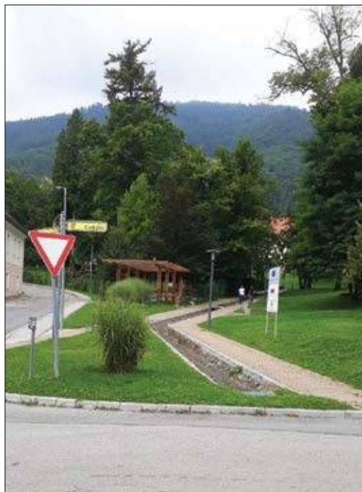
Slika 6: V urbanem okolju je pri prilagajanju na podnebne spremembe potrebna pravilna izbira drevesnih vrst in dosledna nega dreves.

Lösch, 2004). Vendar v daljšem sušnem obdobju tudi zmanjšanje vodnega potenciala ne zadostuje za vzdrževanje potrebne oskrbe z vodo. Zapiranje listnih rež lahko povzroči ali poveča temperaturni stres in prepreči sprejem ogljikovega dioksida. Ker zaprtje listnih rež v celoti ne prepreči izgube vode, daljše in neprekinjeno pomanjkanje vode povzroči poškodbe na listih, ki lahko tudi odpadejo (Bréda in sod., 2006; Burk, 2006; Roloff, 2013a). Fiziološka suša negativno vpliva na številne procese, kot so: rast celic, sinteza celične stene in fotosinteza (Hsiao, 1973). V daljšem in neprekinjenem obdobju fiziološke suše se pojavijo srednjeročni odzivi dreves. Drevesa zaradi zmanjšanja izgube vode v procesu transpiracije odvržejo liste ali v nekaterih primerih (npr. pri hrastu) tudi celotne olistane veje. V letih, ki sledijo dolgim sušnim obdobjem, se na drevesih razvijejo manjši listi (Rust in Roloff, 2004; Roloff, 2013b). Posledica zmanjšane listne površine ter daljšega in neprekinjenega obdobja zaprtosti listnih rež je pojav dolgoročnih odzivov dreves na sušo,