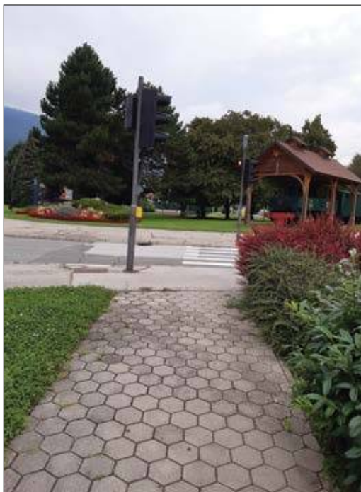
Slika 5: Urbana vegetacija prispeva k izboljšanju mikroklimatskih razmer in vpliva na dobro počutje mestnih prebivalcev.

S primerno načrtovanim sajenjem dreves v bližini stavb lahko zmanjšamo stroške njihovega ogrevanja ali hlajenja. Kvantitativno je varčevanje z energijo odvisno od podnebja, lokacije, vrste in razporeditve dreves ter količine in velikosti listov (Akbari in sod., 1992; Nowak, 2002). Drevesa s hlajenjem in vlaženjem zraka vplivajo na mikroklimo, kar zmanjšuje potrebo energije za klimatizacijo stavb v bližini odraslih dreves. Poleti listopadna drevesa prestrežejo od 75 do 90 % sončne svetlobe, kar zagotavlja naravno hlajenje stavb (Hough, 2004). Velika drevesa listavcev v zimskih mesecih dopuščajo prodiranje svetlobe v zgradbe, kar omogoča izkoristek naravnega ogrevanja sonca (Brown in Gillespie, 1995). Hkrati drevesa zimskim vetrovom ovirajo dostop do stavb in zmanjšajo stroške ogrevanja v zimskih mesecih. Nepravilna razporeditev dreves v bližini stavb lahko poveča stroške ogrevanja ali klimatizacije (Nowak, 2002).