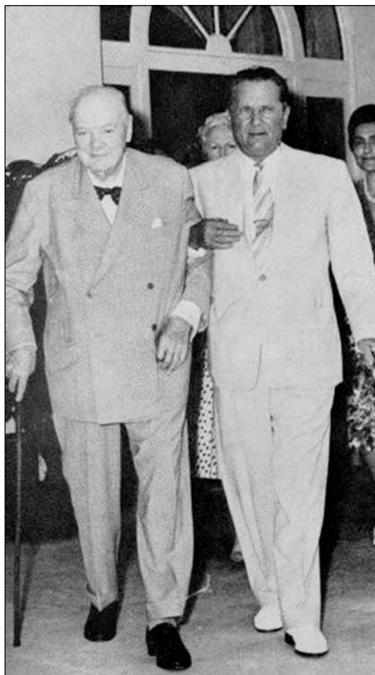
Fig. 9: Tito and Churchill in Split, July 1960.

Sl. 9: Tito in Churchill v Splitu, julij 1960.