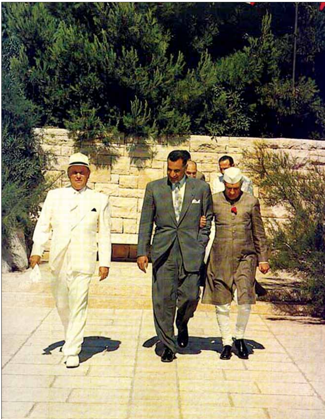
Fig. 5: Tito, Nasser and Nehru on the Brioni Islands, July 1956. Sl. 5: Tito, Naser in Nehru na Brionih, julij 1956.