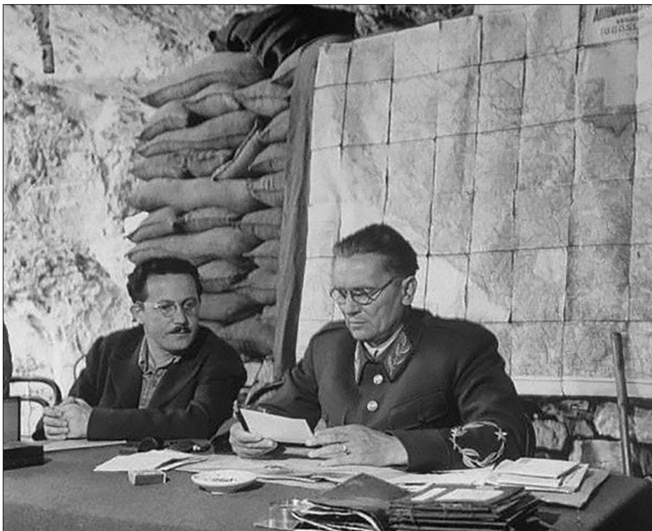
Sl. 1: Edvard Kardelj in Josip Broz Tito na Visu, 1944.