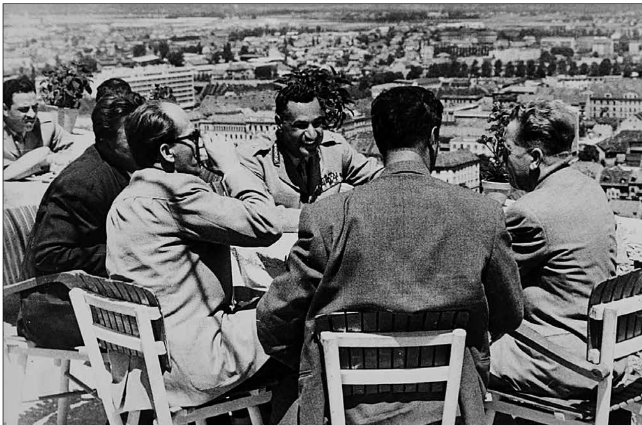
Sl. 2: Naser na Ljubljanskem gradu, 17. julija 1956.