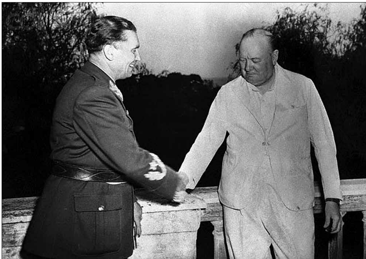
Fig. 1: Tito and Churchill in Naples, August 1944. Sl. 1: Tito in Churchill v Neaplju, avgust 1944.

of transition, foreign policy was technically conducted through the State Secretariat for Foreign Affairs (DSIP), headed by prewar diplomats Ivan Šubašić (1943–1945), Josip Smolaka (1945) and Stanoje Simić (1946–1948). However, the "old" diplomacy was out, and its representatives were not trusted (Petković, 1995, 18–37). The true conduct of international relations was determined in the Politburo of the Communist Party, and much of diplomatic exchange was conducted by Tito himself, through his official visits. His itinerary left no doubts about his ideological and geopolitical leanings: he avoided the West and cruised the East. In 1945, he visited the USSR, then Poland and Czechoslovakia (1946), the USSR again in 1946, then Bulgaria, Hungary and Romania the following year (Petranović, 1987, 5–29; Sovilj, 2007, 133–153). His chief press secretary recalls that "the visits were conducted according to the patterns of the times. Public speeches were mentioning the countries of people's democracies, which have 'a great friend in the USSR, invincible country of socialism'. They were completed with the signing of a treaty of friendship, mutual help and cooperation, according to the template of the same treaty signed before all oth-