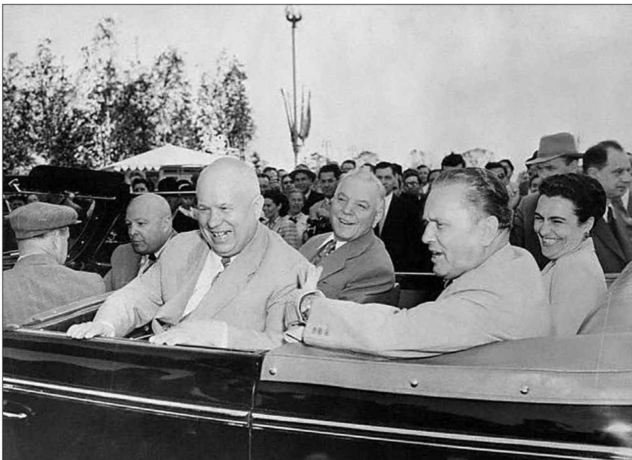
Sl. 1: Nikita Hruščov i Nikolaj Bulganin u Beogradu, 1955.