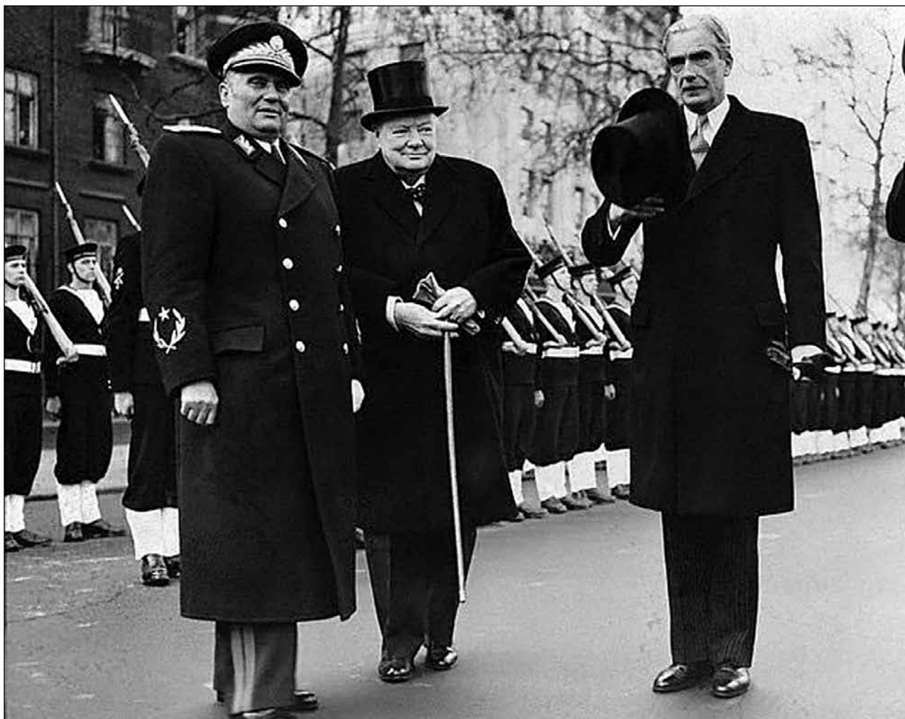
Fig. 3: Tito, Churchill and Eden in London, March 1953. Sl. 3: Tito, Churchill in Eden v Londonu, marec 1953.