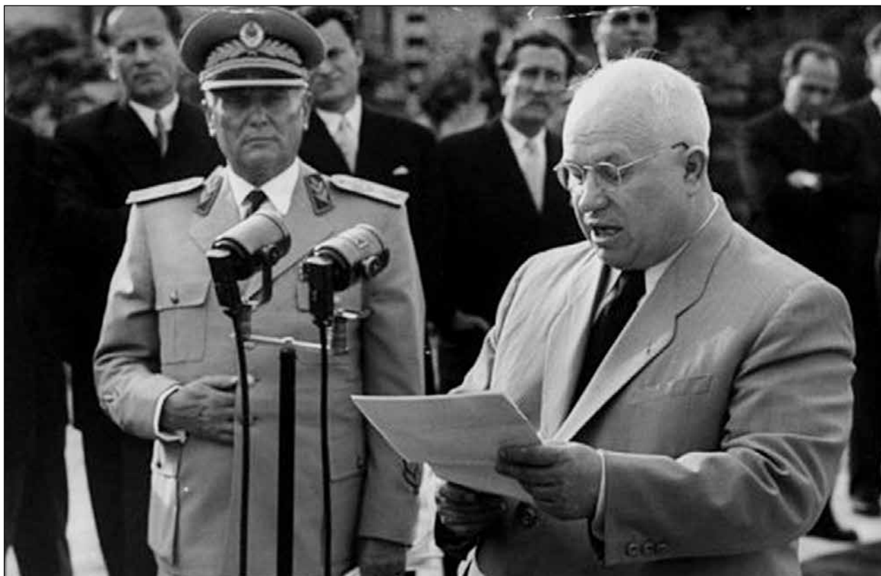
Fig. 4: Tito receives Soviet delegation in Belgrade, June 1955.

Sl. 4: Tito sprejema sovjetsko delegacijo v Beogradu, junij 1955.