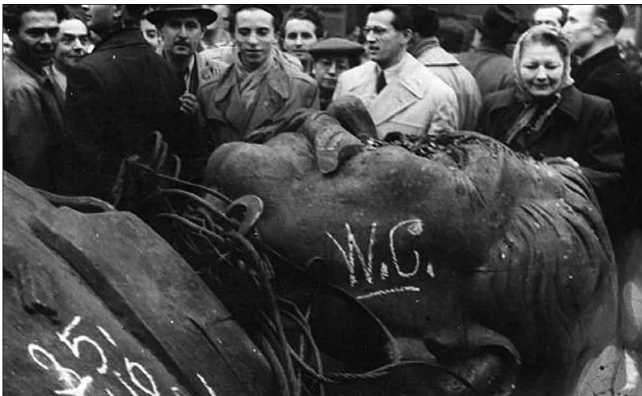
Sl. 2: Staljinov pad – Budimpešta, oktobar 1956. Fig. 2: The fall of Stalin – Budapest, October 1956.

rumunske strane učestale su inicijative za poboljšanje međususedskih odnosa, došlo je do suštinske promene odnosa prema „informbirovcima“ kojima više nisu pravljene smetnje pri repatrijaciji a rumunska štampa i rukovodioci počeli su otvoreno da govore o Jugoslaviji kao socijalističkoj zemlji pa čak i o njenim osobenostima u tom pogledu. Iako je Jugoslavija bila zadovoljna dotadašnjim rezultatima normalizacije svojih odnosa sa Bugarskom, i ovde je očekivano da se XX kongres KPSS-a odrazi pozitivno, pošto je na Aprilskom plenumu KPB došlo do delimičnog uklanjanja Červenkova sa vlasti koji je smatran najodgovornijim za politiku prema Jugoslaviji posle 1948. godine. Suprotno očekivanjima, krajem maja 1956. godine došlo je do otkazivanja uzvratne posete delegacije bugarskog Sobraanja Beogradu jer su Bugari u delegaciju uvrstili neke osobe koje su ranije bile poznate po antijugoslovenskim stavovima. Međutim, taj događaj se nije trajnije odrazio na jugoslovensko-bugarske odnose koji su i dalje zadržali pozitivan trend. U Albaniji koja je bila čvrsto opredeljena za staljinizam, XX kongres KPSS-a doneo je probleme unutar Albanske partije rada u okviru koje su svi „disonantni“ tonovi brzo prigušeni. U odnosu prema Jugoslaviji nisu bili приметni suštinski pomaci jer su Albanci odbijali da razgovaraju o sopstvenoj odgovornosti za događaje koji su nastupili posle sukoba Jugoslavije sa Informbiroom 1948. godine.