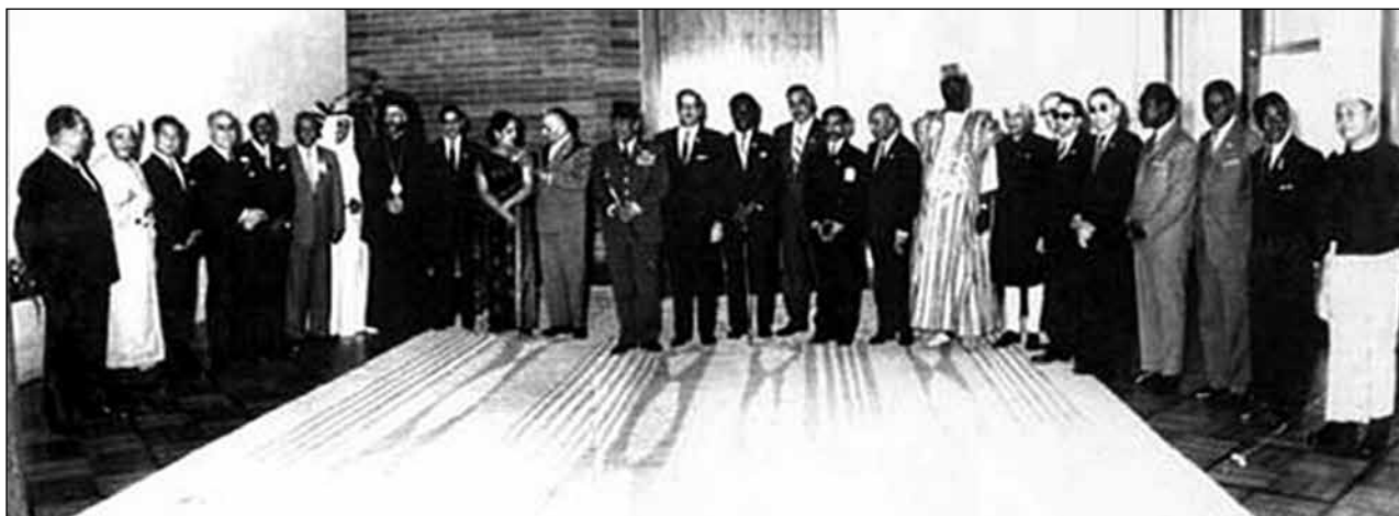
Fig. 8: Tito with the leaders of the Non-Aligned Movement in Belgrade, September 1961. Sl. 8: Tito z voditelji gibanja nevrščenih v Beogradu, september 1961.