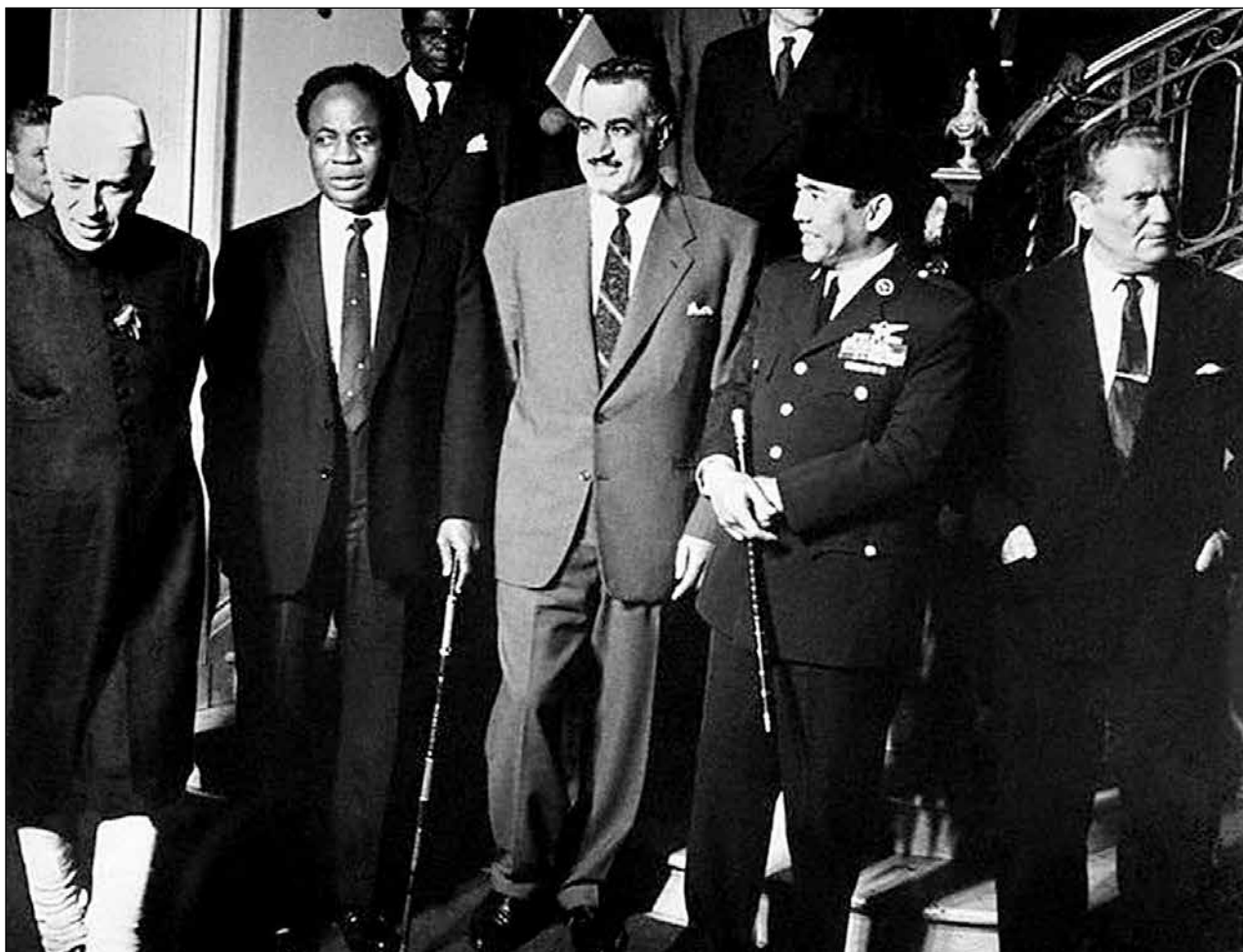
Fig. 6: Nehru, Nkrumah, Nasser, Sukarno and Tito in New York, September 1960. Sl. 6: Nehru, Nkrumah, Naser, Sukarno in Tito v New Yorku, september 1960.

ventures (writing in 1958): “We went aboard Galeb , whose speed was 11 knots per hour. Therefore only the first phase of the road, from Dalmatia to Indonesia, took us 23 days and nights of constant sailing. During this endless sail I said to President Tito that Christopher Columbus needed less time to reach America [...] The joke was not well received” (Mićunović, 1977, 20). Galeb sailed from Dubrovnik at the beginning of December, reaching Indonesia by the end of the month, than continuing to Burma, India, Ceylon, Ethiopia, Sudan and finally Egypt. This was not an isolated escapade. From 1959 until 1961, Tito had spent over six months aboard Galeb . His itinerary led him mostly to the newly founded states of Africa and Asia, as Yugoslav diplomacy did not fail to perceive the importance of the process of decolonization for the future of international relations, and was hurrying to gain a foothold in these quarters of the world. Tito aimed to secure the Yugoslav position within this nascent group of non-committed countries. Gradually, he was able to boost his capacity for diplo-