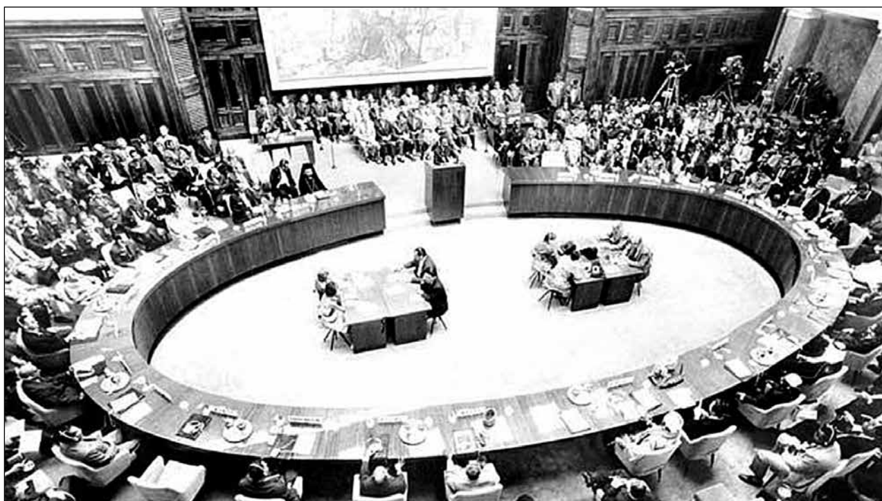
Fig. 7: Summit of Non-Aligned, Yugoslav Federal Assembly, September 1961. Sl. 7: Vrh neuvrščenih v jugoslovanski zvezni skupščini, september 1961.

a resolution urging the superpowers to resume peace negotiations. To that end, Yugoslav mission in New York hosted a meeting on September 29, between Nkrumah, Nehru, Sukarno, Nasser and Tito, who announced their joint resolution in the General Assembly. 6 The resolution did not pass, but it did gain visibility. The timing was right as the topic of this General Assembly session was admitting 16 African countries for membership, a trend which Yugoslavia supported wholeheartedly through the Declaration on the Granting of Independence to Colonial Countries and Peoples in December 1960.