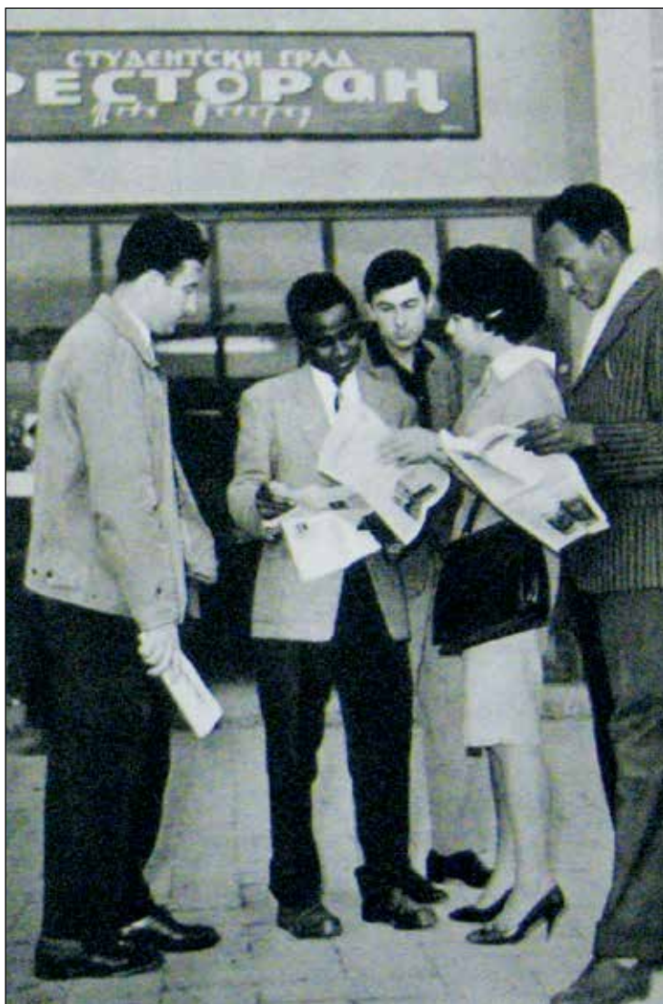
Sl. 1: Grupa stranih studenata ispred restorana u Studentskom gradu na Novom Beogradu. Fig. 1: A group of foreign students in front of a restaurant in Students Town in Novi Beograd. (Vlahovic, J. (1961): Foreign Students in Yugoslavia. Beograd, Jugoslavija Publishing House, 19)

sa smeštajem, ishranom, učenjem i snalaženjem u Jugoslaviji, nisu dozvolili održavanje i intenziviranje ovog vida kulturne saradnje (Bondžić, 2011, 243–248). Posle suočavanja sa raznim teškoćama, od 14 burmanskih studenata koji su došli 1955. ostalo je na studijama 1957. još njih osam, dok je šestoro vraćeno u Burmu. Komisija za kulturne veze sa inostranstvom je i ovakve rezultate smatrala uspehom, s obzirom na postojeće probleme. 19 Međutim, broj stipendija koji je nuden ovim zemljama radikalno je smanjen, i po brojnosti i značaju smenili su ih studenti iz drugih zemalja Azije i Afrike, kojima se približavala jugoslovenska spoljna politika i u njima nalazila svoje političke i ekonomske interese.