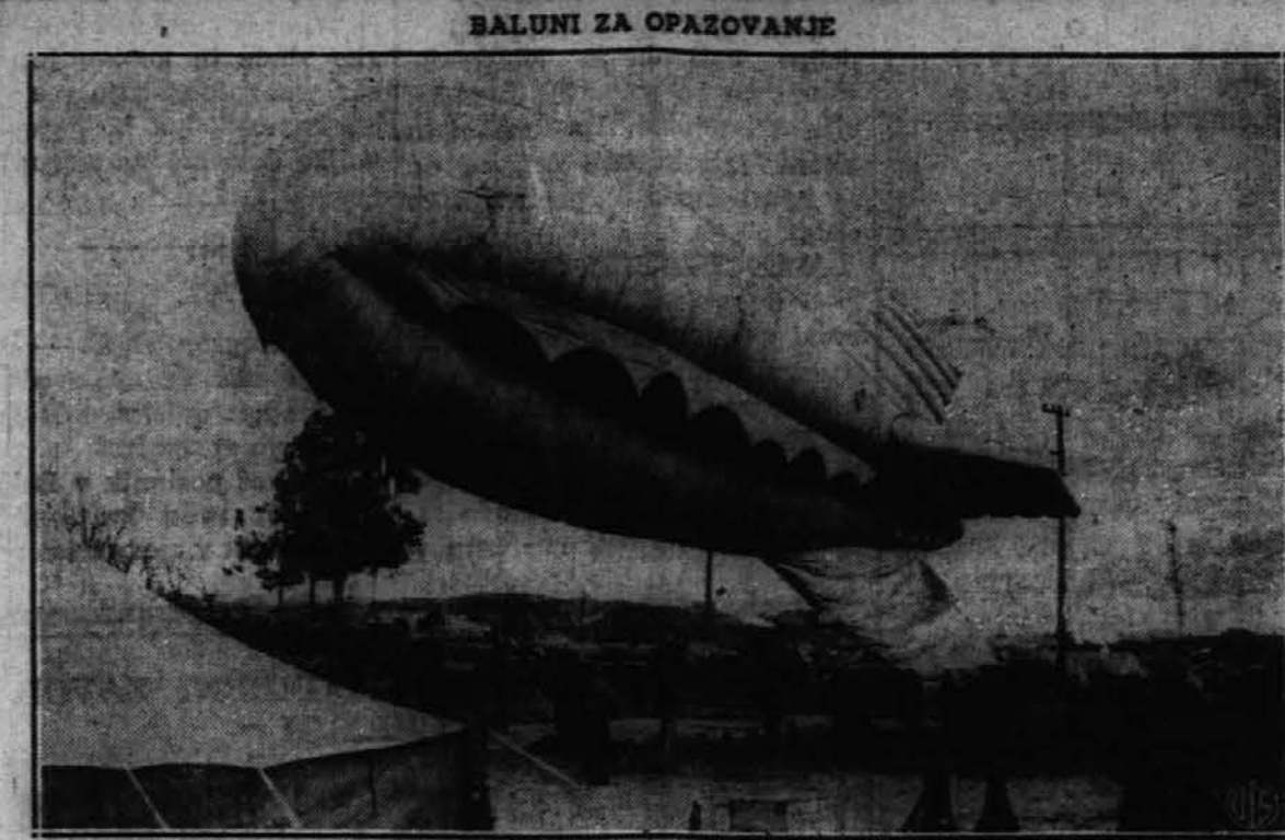
Ob zapadni obali plava na strateških točkah v zraku število balunov, kakor kaže snega gornja slika. Služijo namreč za opazovalne postaje, da se pravočasno odkrije morebitni poizkus japonskega napada.

Ob začetku postnih dni — zdaj je ta dan pepelnica — so se v prvi dobi sv. Cerkve javni grešniki začeli tudi javno pokoriti. Poglavitna pokora je bil za te spokornike post.