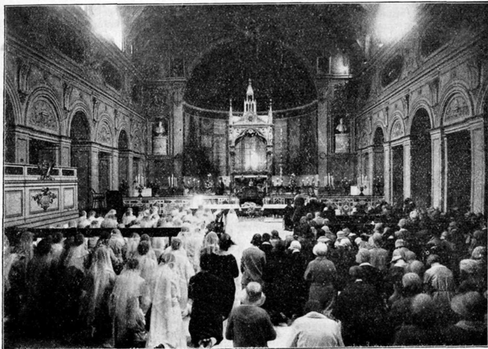
Služba božja v cerkvi sv. Cecilije.

Razgovori so bili silno živahni. Vse delegatkinje so pokazale, da jim je res delo resno. Mladinsko gibanje sedanje dobe itak posebno poudarja čuvstvovanje in življenje