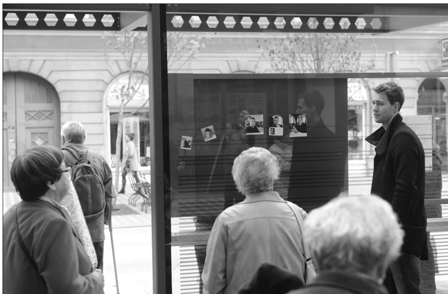
Nalepke portala ZLOvenija v fizičnem prostoru.

Nadaljnja posebnost ZLOvenije je njena prostorska in posledično tudi identitetna fleksibilnost, predvsem potem, ko je projekt izstopil iz digitalne sfere v fizični javni prostor. Ko so namreč posnetki iz digitalnega formata prestopili v fizični svet v obliki nalepk, je ZLOvenija dobila nov pospešek: vdor nestrpnega izrazja iz digitalnega prostora, ki deluje kot fizično zamejena in oddaljena simulacija, je prerastel v realni, nemediatiziran prostor, fizična razgaljenost identitet pa je delovala kot objava tiralic za iskanje oseb, ki so prekršile črko zakona. A kot v intervjuju pojasni avtor portala, je bil tovrstni prehod podob z nasilnimi izjavami v fizični javni prostor povsem nepričakovan, je pa pomenil ključni preobrat, četudi je nastal na podlagi drugih pobud.