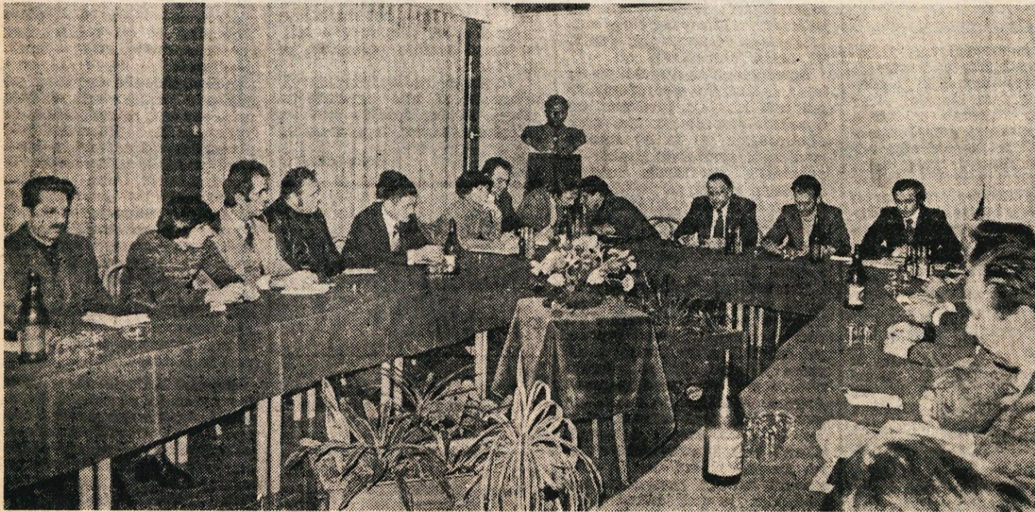
Razgovora na razširjeni seji občinskega komiteja Zveze komunistov Vrhnika se je udeležil tudi tovariš France Popit, predsednik CK ZKS, s sodelavci.

SEMINAR ZA VODSTVA OSNOVNIH ORGANIZACIJ ZSMS S PODROČJA SPLOŠNE LJUDSKE OBRAMBE IN DRUŽBENE SAMOZAŠČITE