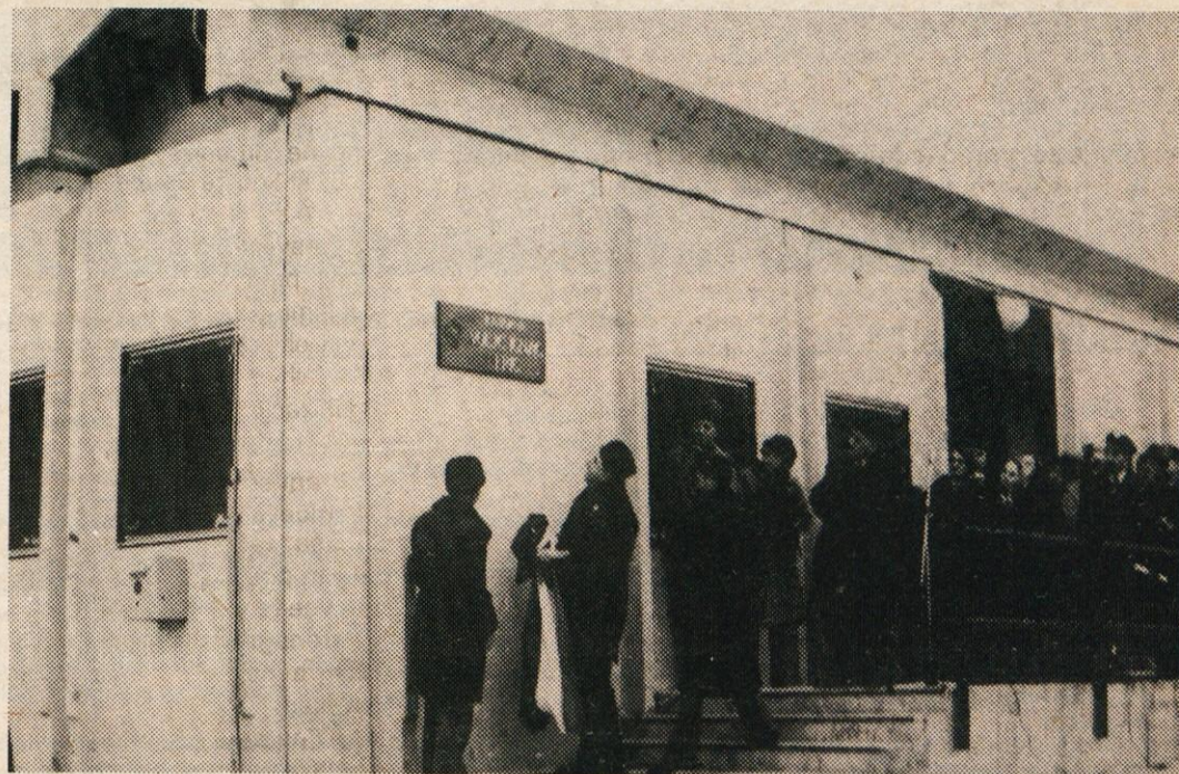
Nova kasarna pri Štampetovem mostu se je ob prazniku naših oboroženih sil poimenovala po vrhniškem narodnem heroju, predvojnem komunistu, prvoborcu in revolucionarju Nacu Voljču-Fricu.