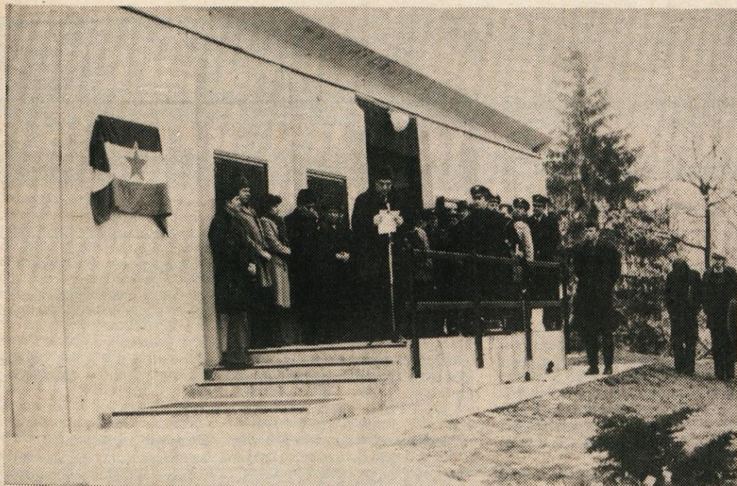
Zbranim vojakom, starešinam in predstavnikom Vrhnike je ob otvoritvi spominske plošče spregovoril vrhniški rojak in prvoborec Nace Voljč.