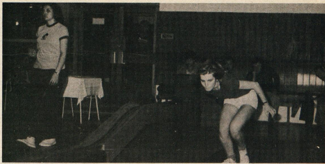
P. P. S tekmovalca ženskih parov. Po slogu sodeč je pričakovati dober rezultat

Kegljaški klub TANKIST je v počastitev jubilejev, smo jih praznovali lansko leto, v počastitev 15-letnice ustanovitve tega kluba in ob prazniku naših proženih sil organiziral kegljaški turnir moških in ženskih parov. Na kegljišču v Mantovi je nastopilo 60 tekmovalcev, 70 tekmovalcev. Dosežen je bil nov rekord kegljača — 1040 podrtih kegljev v 200 lučajih, trije tekmovalci so presegli 1000 kegljev, 14 pa prek 500 podrtih kegljev. Torej doseženi so bili izredno