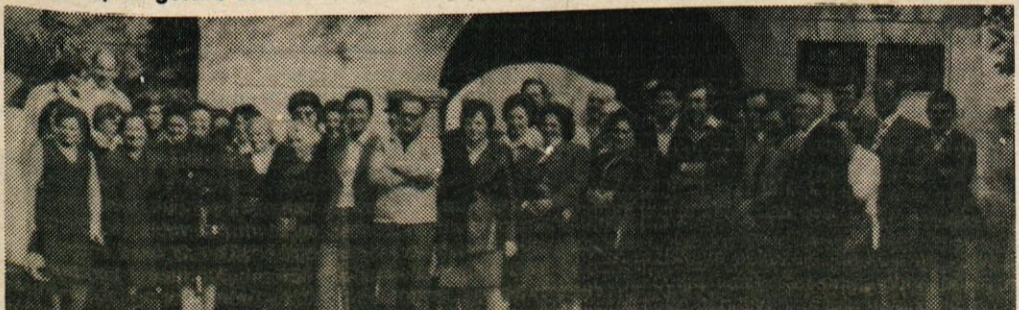
LOŽANI MED POTEPAJEM PO BELI KRAJINI

Nasmejanih obrazov, polni zadovoljstva smo se veselo razšli z željo, da se čim prej zopet srečamo in skupno poveselemo.