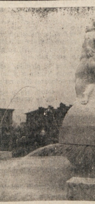
Istovčasno z novo šolo so otvorili na Elizajskih poljanah tudi lep vodnjak. Z novimi hisami, moderno šolo, lepo urejenim parkom in s čednim vodnjakom je ta del postal eden najlepših našega mesta.

Znanstveniki imajo nove instrumente, s katerimi lahko natanko proučijo letenje letal v letu. V laboratoriju so izdelali letalo, ki bi letelo dvakrat hitreje od zvoka. V laboratoriju so zdeli najbolj zanimivo letalo, ki jih pogonjajo turbine. Znanstveniki imajo nove instrumente, s katerimi lahko natanko proučijo letenje letal v letu. V laboratoriju so izdelali letalo, ki bi letelo dvakrat hitreje od zvoka. V laboratoriju so zdeli najbolj zanimivo letalo, ki jih pogonjajo turbine.