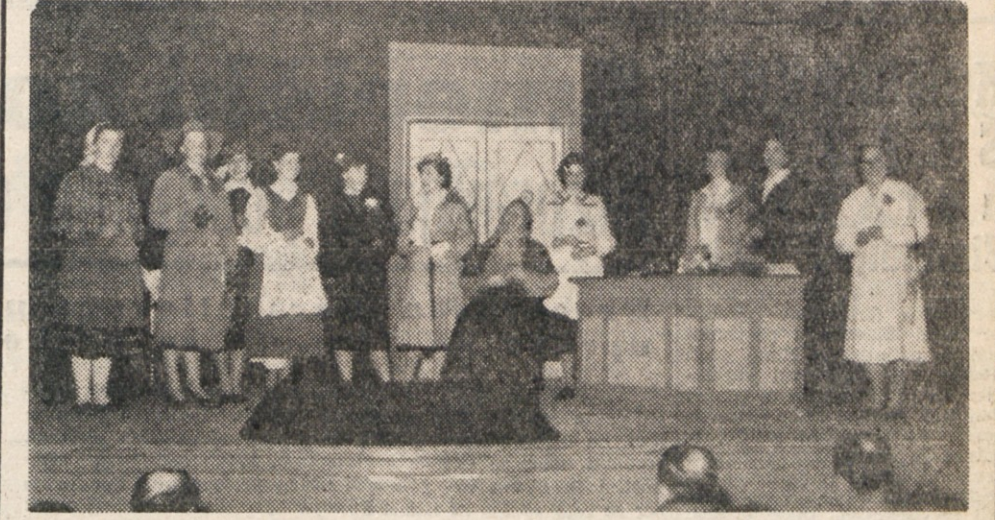
V okviru proslave 10 obletnice ustanovitve OF se je škedenjska dramska skupina predstavila svojemu občinstvu z enodejanko «V posvetovalnici», za kar je zela zaslužen priznanje. Upamo sicer, da to ne bo zadnjič. Dekleta in žene pa so hotele tudi sliko za njihov album. Sliko objavljamo tudi mi, da jim bo v spodbudo za bodoče delo in večje uspehe.