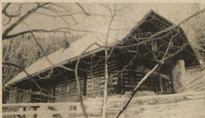
Prenovljena Kačnikova domačija