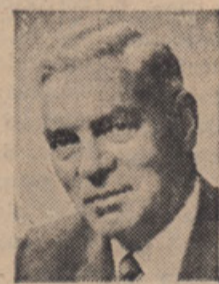
Hon. W. A. Gendfellow, Minister

ZDRUŽEVANJE VSEGA ČLOVESTVA, neglede na raso, barvo ali vero, je ljubezen zemlje in vse kar ona predstavlja. Ze od vsega početka je bil človek odvisen od borbe z zemljo, ker brez življenja, ki zraste iz naših plodnih polj, človek nebi mogel živeti. Naša mesta, trgi in vasi bi postala prazna in bi izumrla.