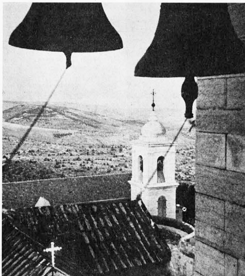
Zvonovi iz betlehemske bazilike naznanjajo Kristusovo rojstvo