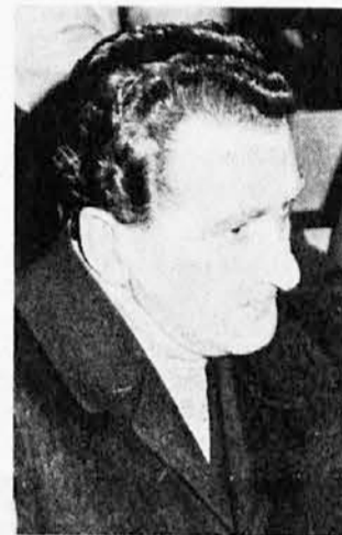
Generalni vikar goriške nadškofije msgr. Ennio Tuni