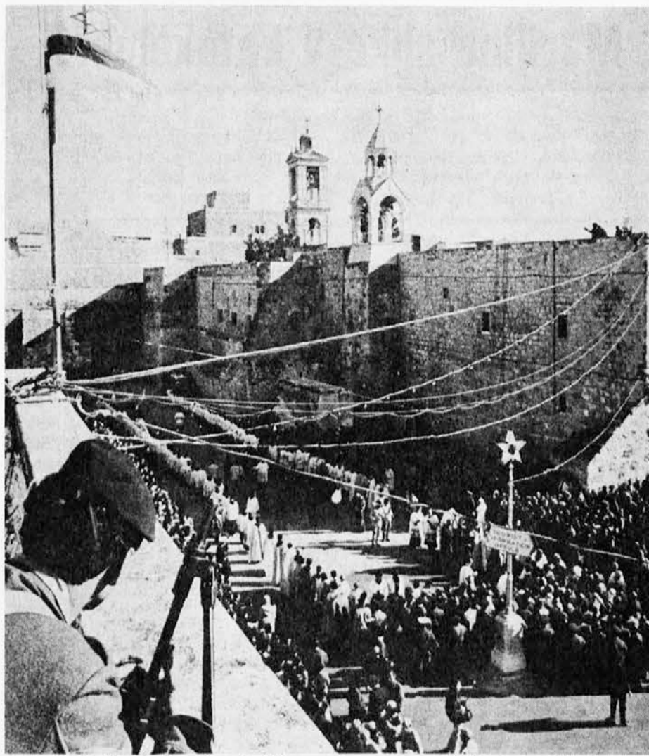
Božična procesija v Betlehemu ob varstvu izraelskih brzostrelk

Prijatelji Katoliškega glasa! Kupujte, naročajte pri trgovcih in podjetjih, ki vam voščijo za praznike. Njihova pozornost do vas zasluži vaš obisk pri njih.