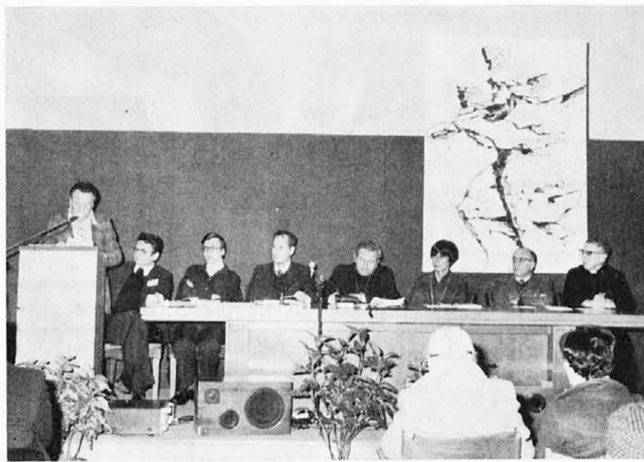
Predsedstvo zborovanja tržaške Cerkve med plenarnim zasedanjem