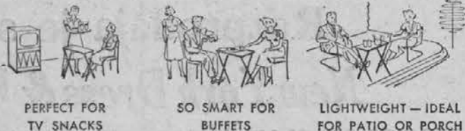
PERFECT FOR TV SNACKS SO SMART FOR BUFFETS LIGHTWEIGHT — IDEAL FOR PATIO OR PORCH

Here's the answer to the snack problem! Puts an end to "knee balancing" and embarrassing spills. 18 x 14 inch trays are stain- and heat-resistant. Sturdy rubber-tipped legs. Get a set of four today — perhaps never again at this low price.