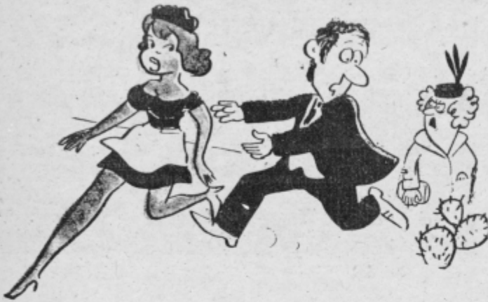
Resnično draga, spriči te nenadne ohladitve se želim samo malo ogreti