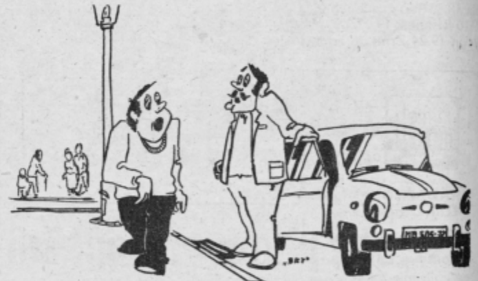
- Kje pa imaš avto, Tonček? - Veš, moral sem ga prodati, da sem lahko plačal vse prekrške, ki sem jih z njim napravil po veljavnosti novega zakona o temeljih varnosti cestnega prometa.