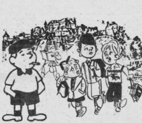
- Kateri razred si pa ti končal, da že lahko kadiš?