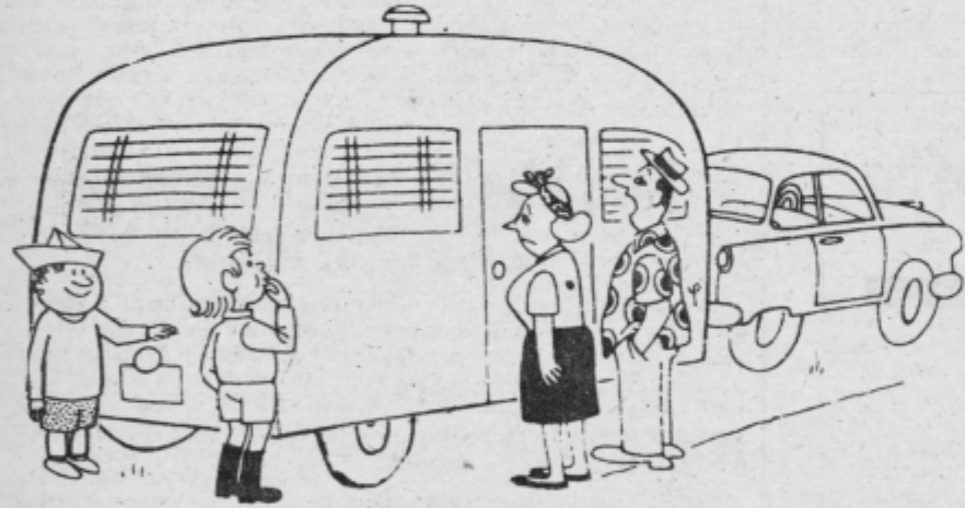
- To, vidite bo deset dni naš potujoči dom! - Očka, a ti bo regres zadostoval za bencin?