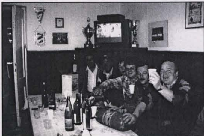
Le tre coppie vincenti