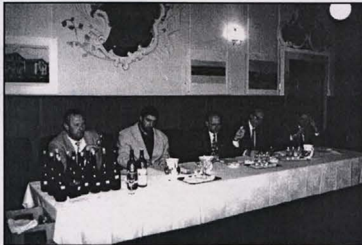
I 5 assaggiatori al lavoro