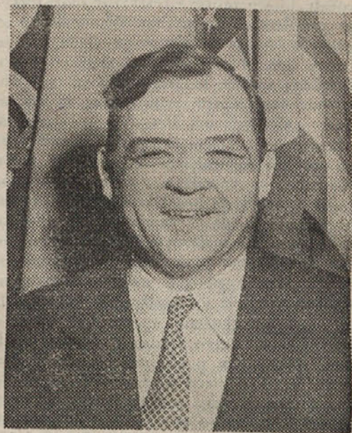
DR. LUTHER EVANS

Po uradnih poročilih je ta obisk sedaj določen za drugi teden meseca novembra. Pri tem obisku bodo glavni predmet razgovorov gospodarska vprašanja. Kakor trdi uradno poročilo nadalje, ni ta obisk jugoslovanskega zunanjega ministra na Dunaju v nobeni zvezi s tržaškim vprašanjem.