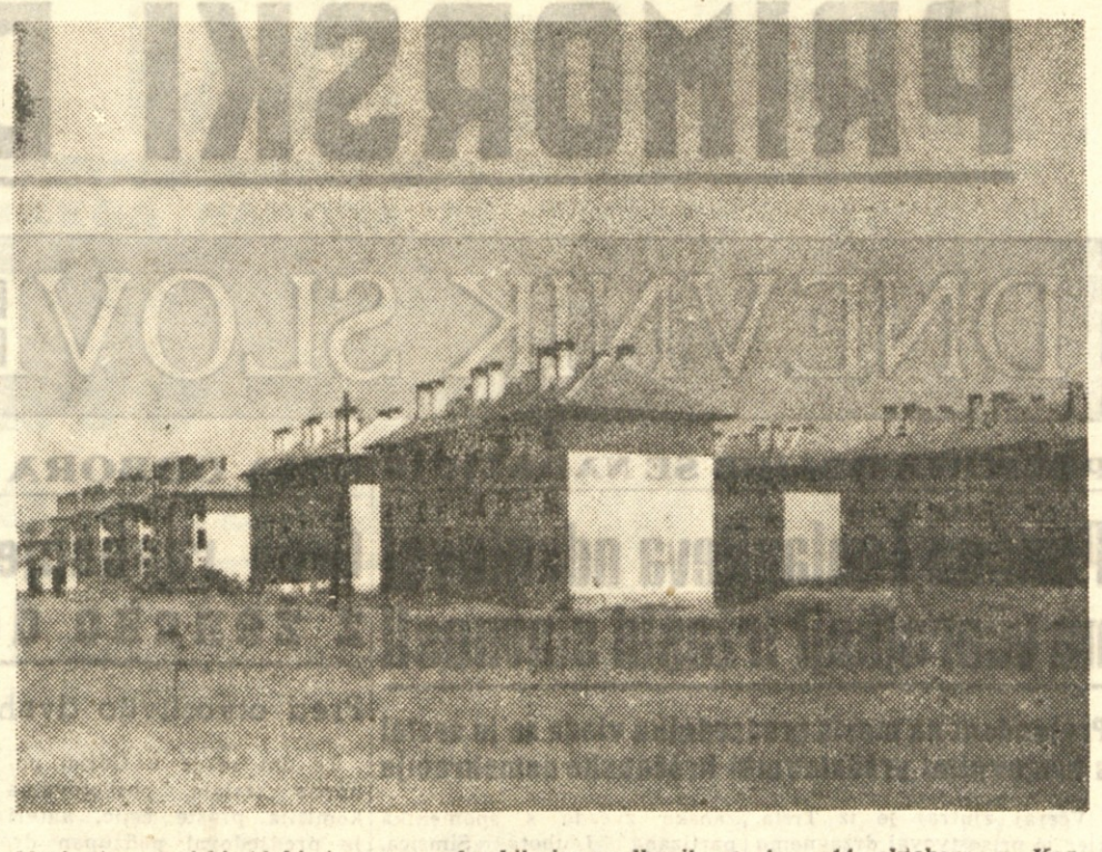
Novi stanovanjski bloki tovarne rudarskih in gradbenih strojev «14 oktobra» v Končevem (Srbija)

Če v naravo, po drugi strani, postali osnovni pojmi fizike in biologije v tolikšni meri zapleteni in abstraktni, da ne doprinejo k razumevanju skoraj ničesar iz oblikovanja svetovnega nazora pri človeku, s človekom sodelujejo različne vrste nevarnosti, ki so razpisane od prof. Junga s pariške Sorbonne, a da postane v obeh povprečnih državljana nova oblika mistike. Zeleni pa bi, da bi vsaj šlo za poizkus vzpostaviti preprosto ravnanje. Navedenim dejstvom v zvezi z letetimi krožniki ter politične okoliščine, ki so s tem v zvezi, in zmeda je popolna. Razgovorjal sem se s kmetičami, ki so mi ob zadnji nebesni prikazni omenile možnost, da gre za prve znake, da se približuje konec sveta, ki naj bi nastopil v letu 2000.