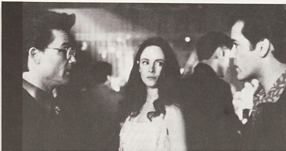
KURT RUSSEL, MADELEINE STOWE IN RAY LIOTTA V FILMU UNLAWFUL ENTRY JONATHANA KAPLANA

Mary Stuart Masterson. Film je časovno razdeljen na dve obdobji. V sedanjosti se Kathy Bates pod vplivom zgodb Jessice Tandy o obdobju med obema vojnama, ko sta njeni prijateljci imeli v lasti malo restavracijo v Alabami, osvobajajo občutka odvečnosti in vzame svoje zakonsko življenje v svoje roke. Avnet je film zastavil nepretenciozno, brez sluzavosti kake Barbre Streisand in z dovolj humorja. Tudi Bruce Beresford je posnel Rich in Love po literarni predlogi Josephine Humphreys. Družinsko življenje, prikazano skozi oči odraščajoče srednješolke, ki mora zaradi nenadnega materinega odhoda skrbeti za svojega očeta, zmedenega zaradi ženinega odhoda, za nameček pa se vrne še njena sestra, noseča in s svojim zaročencem, je obravnavano sveže in razplet je prav presenetljiv — družinski člani odidejo vsak po svoji poti, hišo pa prodajo. Film je po temah (ljubezen in odraščanje) in po pristopu blizu enemu izmed lanskoletnih favoritov, The Man in the Moon Roberta Mulligana. Svojevrsten pogled nazaj je bil Tomorrow veterana Josepha Antonyja iz leta 1972, prikazan ob priliki francoske redistribucije. Pravi low budget komorni film, posnet po Faulknerjevi predlogi in gledališkem komadu Hortona Footea, kjer lahko občudujemo izvrstno ČB fotografijo in igro Roberta Duvala.