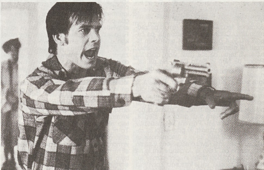
ONE FALSE MOVE , REŽIJA CARL FRANKLIN, ZDA, 1991

Utrujen od poti in slabega vremena sem se prvi dan spraševal, kaj me je sploh gnalo na sever Francije. Letošnji program je bil brez kratkih filmov in s samo enim dokumentarcem ( aaaggh! ), brez tako hvaljenega Reservoir Dogs ( sigh ), nekaj filmov je bilo pobranih z Berlina ( Gas, Food, Lodging, Swoon in Light Sleeper ), Roka, ki ziblje zibko je bila na sporedu že v Ljubljani. Tudi prvi prikazani filmi niso obetali ravno bogate ameriške filmske letine. Vrh tega mi zvečer ni uspelo priti na premiero Unforgiven Clint Eastwooda, ker je bila velika kongresna dvorana novozgrajenega Centre International de Deauville polna do roba. Prva pozitivna stvar je bila šele specialna projekcija že starega ameriškega box-office hita, Wayne's World Penelope Spheeris. Ko se mi je uspelo prebiti na svoj sedež, sem imel popolnoma mehka kolena in v trebuhu tisti občutek, zaradi katerega se Hemingwayevi junaki preganjajo po Afriki in streljajo nosoroge v napadu. K sreči je naslednje dni organizatorjem uspelo vsaj za silo urediti kaos na vhodu, zmanjšalo pa se je tudi število obiskovalcev, tako da čakanje na ogled večernih projekcij