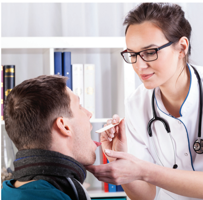
V ZD Ormož so kader precej pomladili. Fotografija je simbolična.

Medtem ko se marsikje po državi soočajo s težavo, da pacienti zaradi prezasedenosti ne morejo dobiti osebnega družinskega zdravnika, je sedaj v Ormožu situacija povsem drugačna. Dogaja se, da imajo mladi zdravniki premalo opredeljenih pacientov. Gre za sistemsko težavo na področju financiranja, razlaga direktorica. »Prizadevamo si, da dvignemo delež opredeljenih pacientov pri mladih zdravnikih. Občane seznanjamo in informiramo o tem, kateri zdravniki sprejemajo paciente. Gre za težave na sistemski ravni na področju financiranja. O tem smo poročali tudi ministru za zdravje. Dogaja se namreč, da zdravniki z visoko glavarino, ki imajo praviloma koncesijo, nimajo težnje glede zmanjšanja števila opredeljenih pacientov zaradi financiranja.«