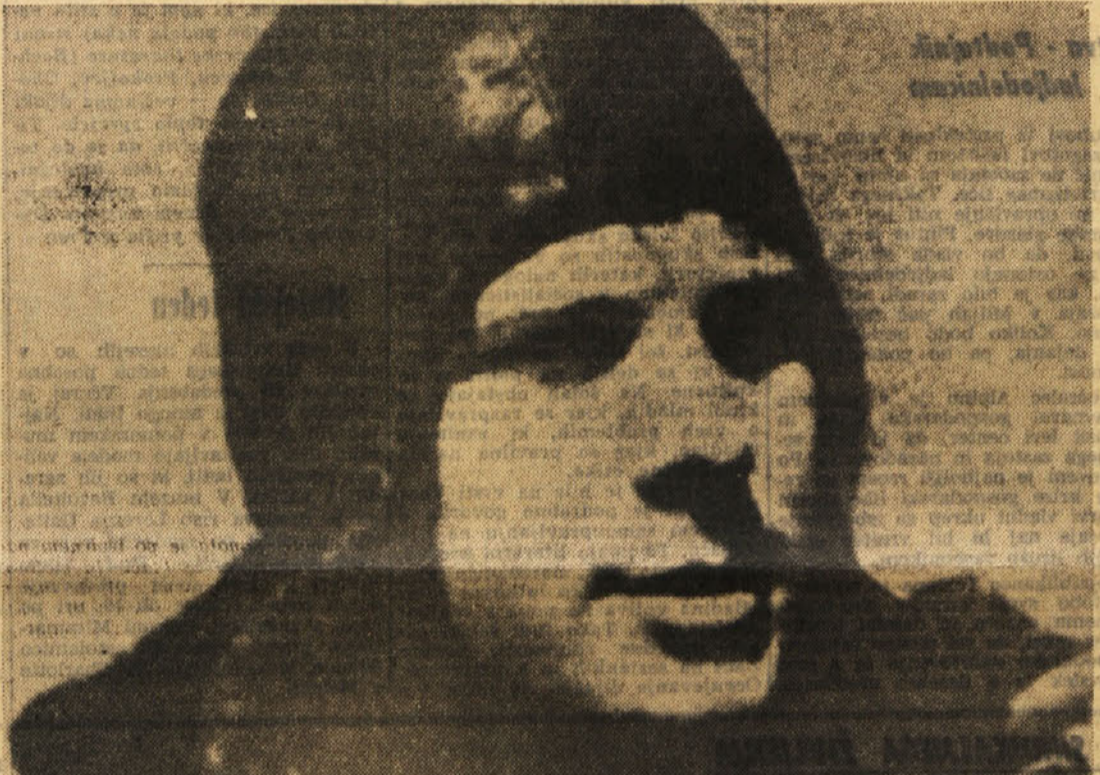
«Teško je reči, kdo od teh bo prvi stopil na najbližji planet, toda ti so med nami...»