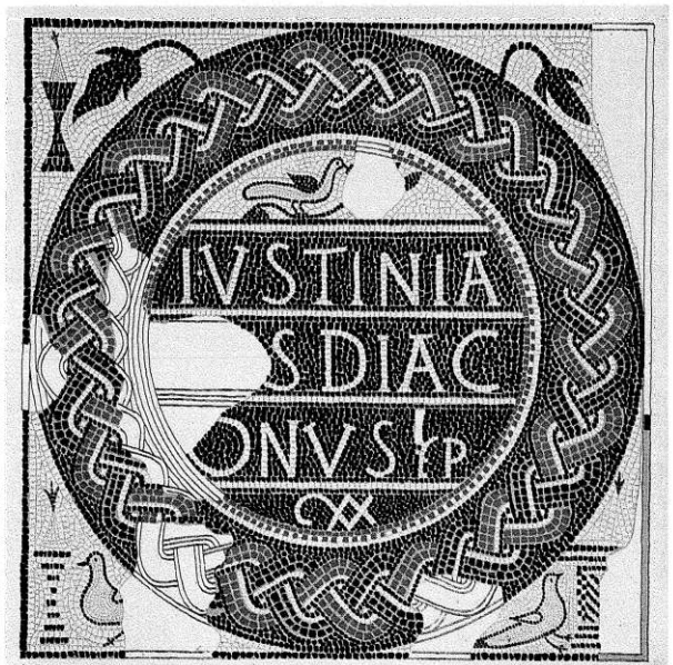
Donatorski napis diakona Justinijana v mozaičnem tlaku zgodnjekrščanske bazilike, odkrite leta 1897 v Celju. Foto: Marko Zaplatil. Po Riedlu.

število, zapisano seveda z rimskimi števkami, ki pove, koliko kvadratnih čevljev mozaika so postavili z darovano vsoto. Medtem ko je samostalnik pedes dosledno krajšan s P, je glagol fecerunt večinoma okrajšan s F, včasih s FCR ali FC, včasih pa tudi v celoti izpisan. Kot primer donatorskega napisa naj navedem enega iz Ljubljane: Archelaus et Honorata cum suis f(ecerunt) p(edes) xx (Arhelaj in Honorata sta s svojci naredila - oziroma plačala izdelavo - dvajsetih kvadratnih čevljev mozaičnega tlaka).(50)