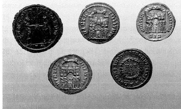
Novci iz Numizmatičnega kabineta Narodnega muzeja v Ljubljani, ki so enaki ali podobni tistim, ki so se nahajali v slatenskem zakladu: antoninijan Avrelijana, argenteusi Konstancija Hlora, Dioklecijana in Maksimijana ter folis, kovan za Konstantina II.