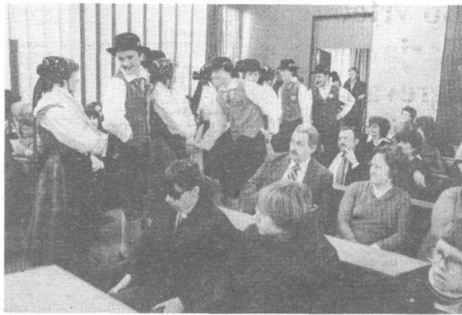
V svet narodnih plesov so popeljali člani folklorne skupine Hoje.