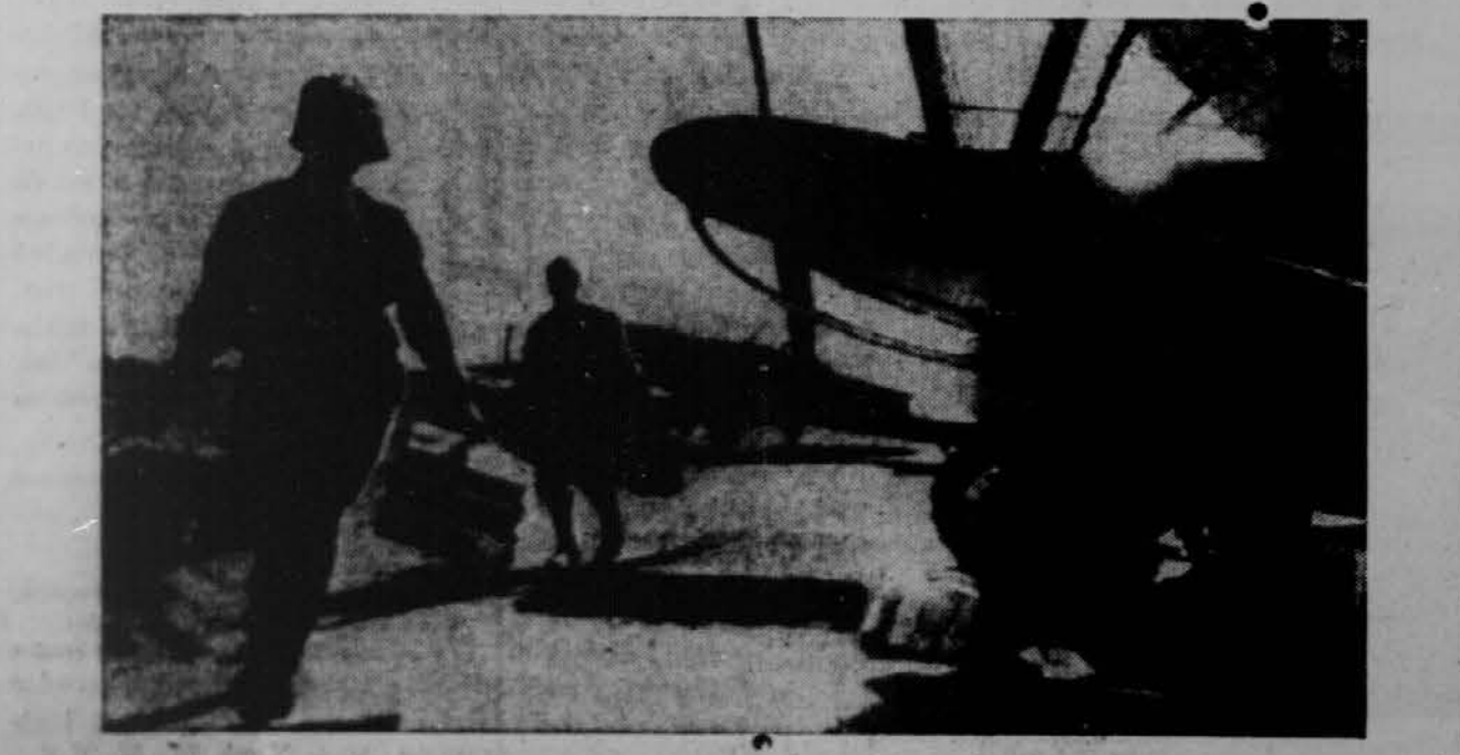
Ruski aeroplani prevažajo časopise za ljudi po osvojenih krajih.

Švedski parlament na tajni seji razpravlja o prošnji Zdr. držav in Anglije, da Švedska ne bi pošiljala Nemčiji vojnih potrebščin. Odgovor bo v kratkem sestavljen in bo imel dve poglavni točki: 1. Švedska se mora držati svoje pogodbe, ki jo je sklenila z Nemčijo in glede tega ne more sprejeti nobene pritiska od zunaj, in 2. Tobin, ki je predsednik odbora imenovanega v ta namen po