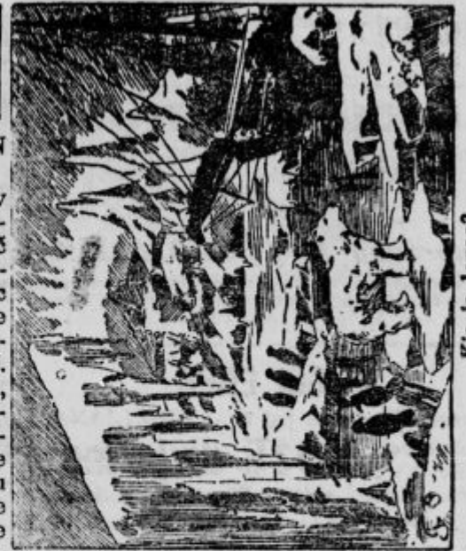
Kje je lovec?

sposobno za eksport, kupuje po najvišjih dnevnih cenah družba »CARBONARIA«, Kočevje. 341