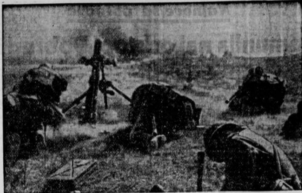
Pretrajliv prizor z bojnih poljan