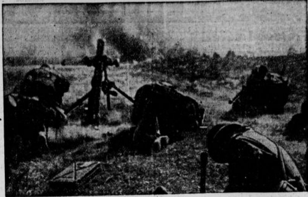
Pretrsljiv prizor z bojnih poljan