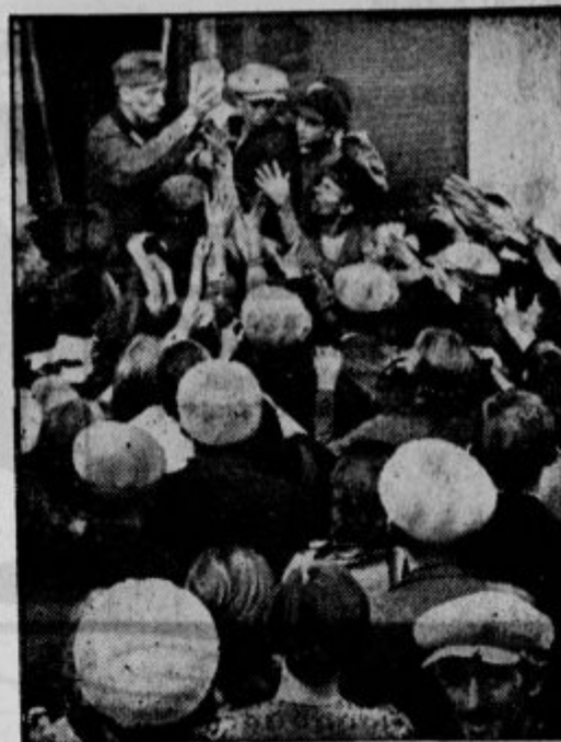
Razdelitev kruha med prebivalstvo iz bojne vihr

V Ljubljani imamo pa še mnogo mož, ki so si zadnjih pet let prisluzili to častno odlikovanje našega mesta, vendar jim ga pa mestni svet ne more več podeliti in bo zato mestna uprava gotovo poiskala pota in našla ta ali oni način počastitve, da bo posebno zasluge svojih občanov lahko spet nagradila v spodbudo vsem občanom.