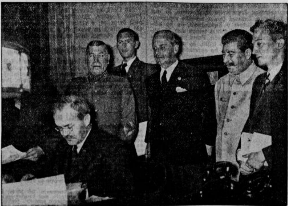
Sovjetskoruski komisar zunanjih zadev, Molotov, ko vpričo Stalina, Ribbentropa in članov vrhovne vlade podpisuje sporazum s Nemčijo. Na sliki: od leve; sovjetskoruski generalni šef Stapotnikov, zraven Ribbentrop, poleg njega Stalin in ruski poslanik v Berlinu, Perlov

Vozni red korijer se zboljšuje. S 1. oktobrom bo podjetje Ribi znova otvorilo nekatere vožnje, ki so bile pred tedni zaradi varčevanja z bencinom ukinjene. Upajamo, da bodo temu zgledu lahko sledila tudi druga podobna podjetja, kar bi bilo veskakor dobro znamenje.