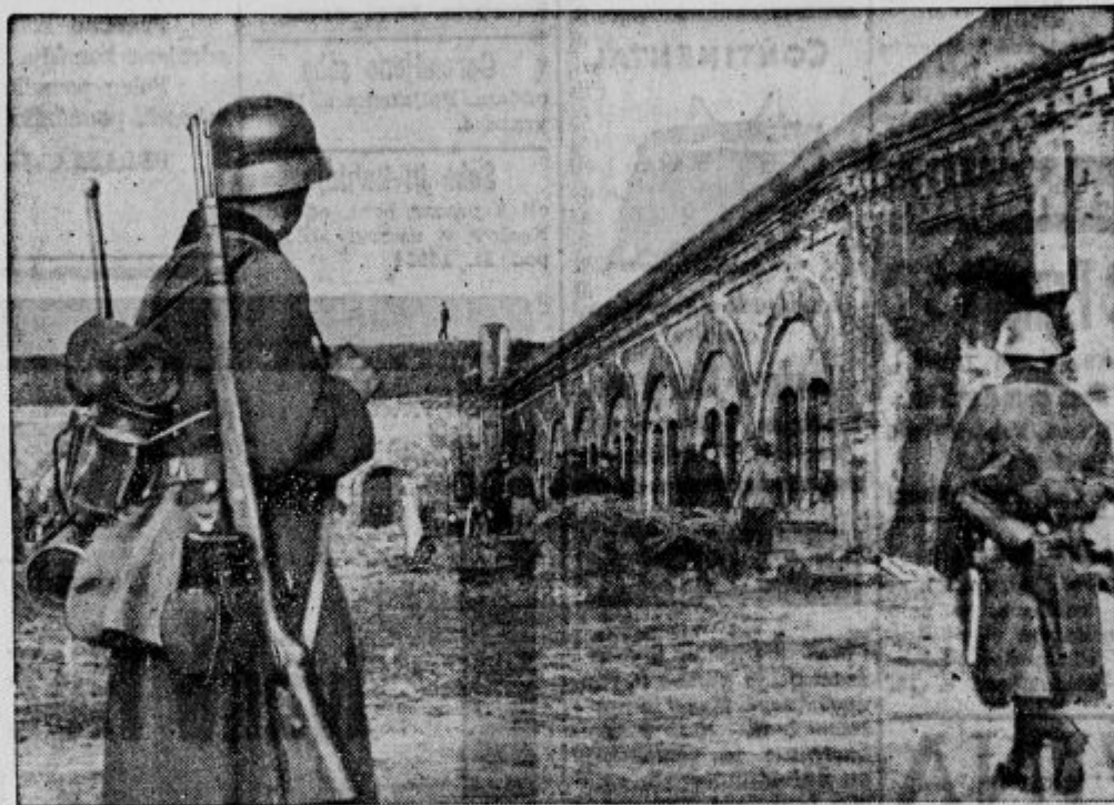
V Bialicu na Poljskem na vso paro hitijo popravljati ceste in tramvajsko progo v mesta

ki morajo biti rojeni naši državljani. Prednost imajo neozenjeni in oni, ki so oslužili vojaški rok ali pa so istega oproščeni. V službo sprejeti kandidati bodo imeli 70 do 90 dni dnevno. Po uspešni službi bi se predložili za stalne državne civilne ali vojaške (inženir-poročnik) nameščence z mesečno plačo. Podrobna pojasnila daje barutana Kamnik.