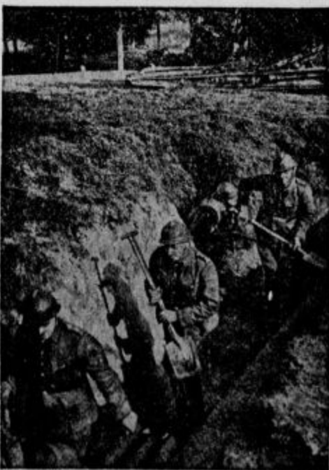
Belgijsko vojaštvo v jarkih

Iz Tirane poročajo: Po najnovejših podatkih je bilo leta 1938 v Albaniji 1.373.857 ovac. Od teh je bilo 75 odstotkov odraslih plemenitih ovac, 10 odstotkov samice in samec, ostali so kostruni. Glede na površino Albanije pride 57 ovac na 1 kv. kilometer. V Italiji je 33 ovac na 1 kv. km. V Albaniji je največje število ovac v pokrajinah: Argirocastro, Berati in Elbasan. Valona ima 101 ovca na kv. km, skoraj toliko kot provinca Rim, kjer je bilo po štetju iz l. 1930 — 144 ovac na enem kvadratnem kilometru.