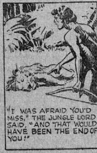
"I WAS AFRAID YOU'D MISS," THE JUNGLE LORD SAID, "AND THAT WOULD HAVE BEEN THE END OF YOU!"

Tarzan se je čudil, ko ga je deklica zmirjala, ker je ubil leva.