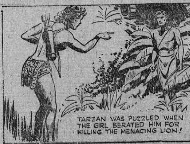
TARZAN WAS PUZZLED WHEN THE GIRL BERATED HIM FOR KILLING THE MENACING LION!

Tarzan se je čudil, ko ga je deklica zmirjala, ker je ubil leva.