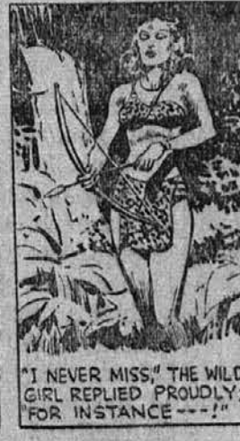
"I NEVER MISS," THE WILD GIRL REPLIED PROUDLY, "FOR INSTANCE . . ."

"Bal sem se, da ti zgrešiš," odgovori gospodar džungle, "in potem bi bilo po tebi!"