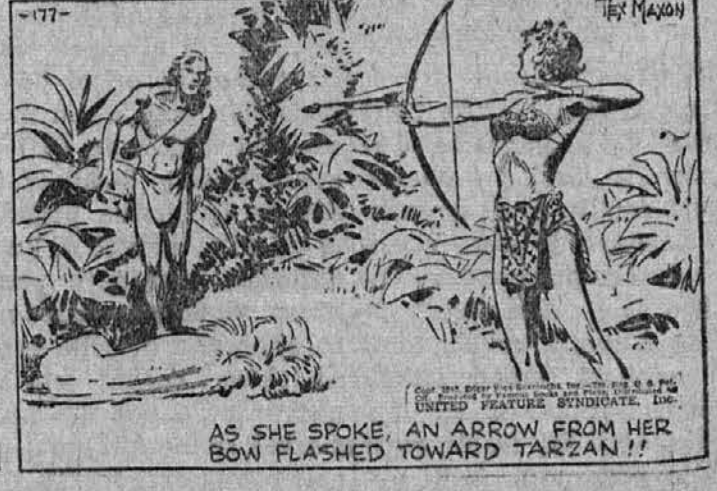
AS SHE SPOKE AN ARROW FROM HER BOW FLASHED TOWARD TARZAN!!

"Ja nikdar ne zgrešim," odgovori divja deklica ponosno; "na primer . . ."