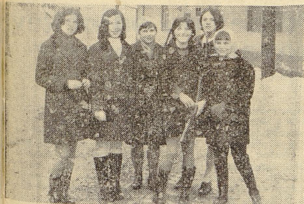
Slika prikazuje strelke, ki so postale ekipne zmagovalke na strelskem tekmovanju za praznik dneva žena