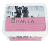
SLAD.PLANICA 1L LJUB.ML. 2,89 EUR