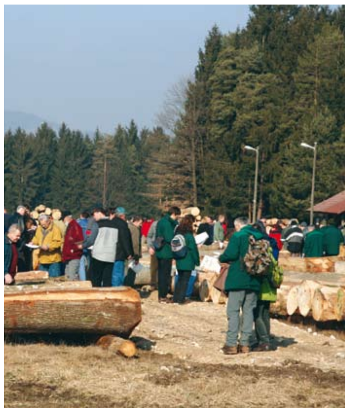
Licitacija lesnih sortimentov na letališču v Slovenj Gradcu

Ob dnevu Zemlje je Društvo lastnikov gozdov Tisa Domžale v sodelovanju z Zavodom za gozdove organiziralo predavanje o ogrevanju z lesom na sodoben način. Predavanje, ki je