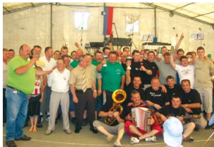
Skupna slika tekmovalcev v vlečenju vrvi v Pečah