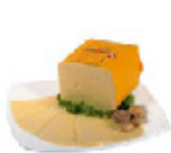
SIR EDAMEC MERCATOR 4,99 EUR/kg