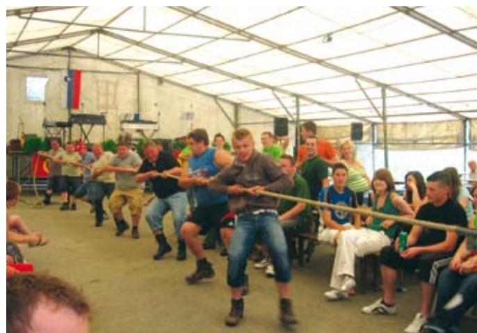
Zmagovalci v akciji