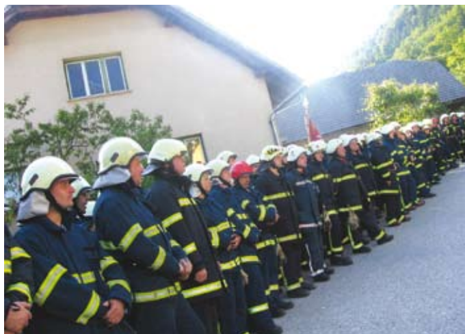
Zbor gasilcev v Veliki vasi

do Velike vasi. Našlo se je kar nekaj nejevernih Tomažev, ki so dvomili v uspeh akcije. Seveda so gasilci vzeli vajo