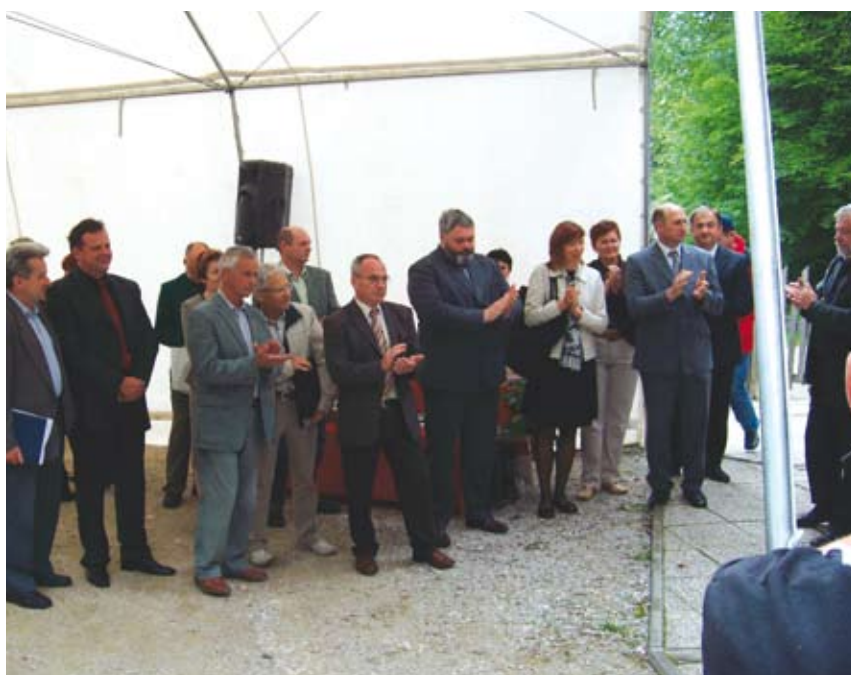
Slovesnosti se je udeležilo več županov, tudi moravški