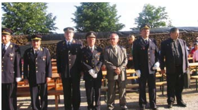
Poveljstvo in gostje na osemdesetletnici

Praznovanje osemdesetletnice so gasilci iz Velike vasi začeli delovno, z gasilsko vajo, s katero so nameravali iz 3 km oddaljene Save, spraviti vodo po gasilskih cevih