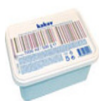
SLAD.MERC. 1L SORT.GENER. 1,02 EUR