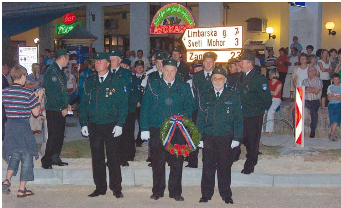
Veterani na prireditvi za dan državnosti