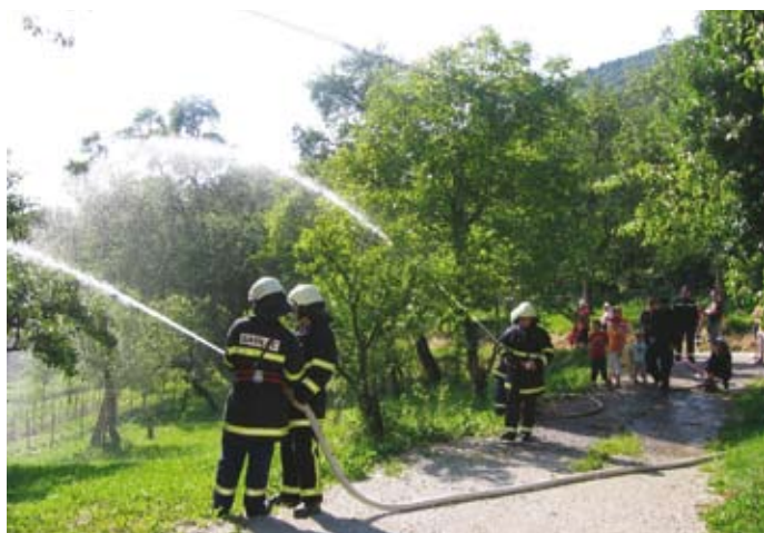
Curki Save iz gasilskih cevi v Veliki vasi

Osrednji dogodek prireditve ob jubileju je bil prevzem in blagoslov nove gasilske brizgalne. Številni člani so prejeli priznanja. Po lepo obiskani slovesnosti so za zabavo, kakršne v Veliki vaši že dolgo ni bilo, igrali Gadi.