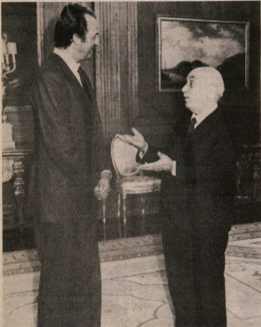
Amintore Fanfani se mudi na zasebnem obisku v Madridu. Ob tej priložnosti ga je sprejel tudi kralj Juan Carlos