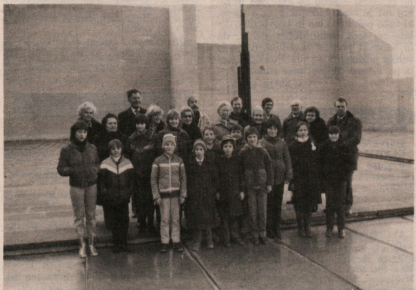
Učenci osnovne šole Dušan Muniha - Darko so včeraj obiskali Rižarno