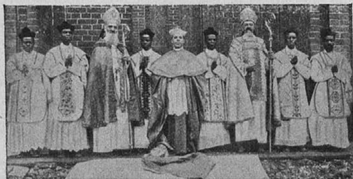
Apostolski delegat z misijonskimi škofi in zamorskimi duhovniki.

Že dolgo so se pripravljali kristjani raznih plemen v našem apostolskem vikarijatu na sprejem delegata svetega očeta. Delegat nas je obiskal v mesecu Srca Jezusovega. Nj. Prezvzišenost se je podal najprej v misijon Zobia, potem v Titute, kjer je velik vihar pokvaril vso lepo dekoracijo za sprejem. V Buta, kjer stanuje škof, je bil sprejem po-