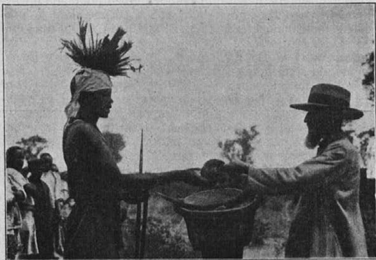
Spreobrnjen zamorski čarovnik slovesno izroča misijonarju svoje fetišee. Mesto teh mu misijonar podari rožni venec.

Tako se je pouk srečno nadaljeval toliko časa, da se je pojavila pri nauku o zakramentu sv. pokore nova težava. Ženica je nauk prav dobro razumela, a je trdila venomer, da nima nobenega greha.