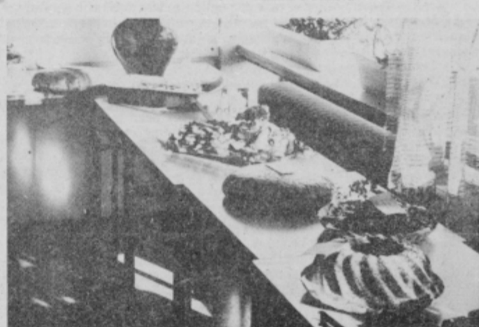
V avli OŠ je bila razstava likovnih del in aktiva žena krajevne skupnosti