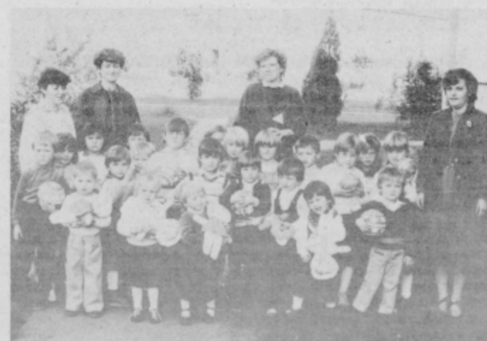
Malčki iz vrtca v Dornavi.

V vrtcu je trenutno 77 otrok in je v celoti zaseden. Imajo dve skupini (od dveh do treh let in od treh do sedmih let in dve skupini male šole. Z otroki delajo tri vzgojiteljice in dve varuški.