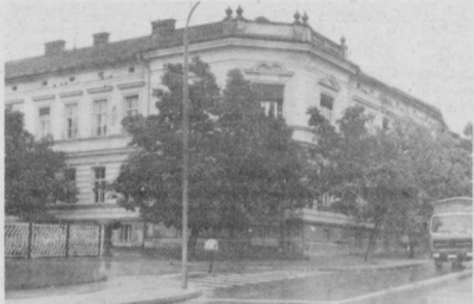
Osnovna šola Ormož.