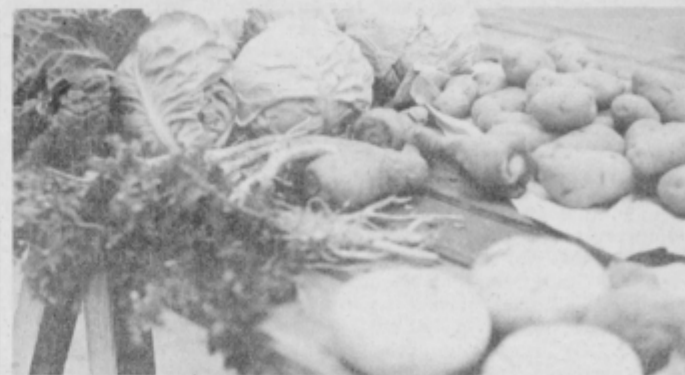
Bogata ponudba vrtnin