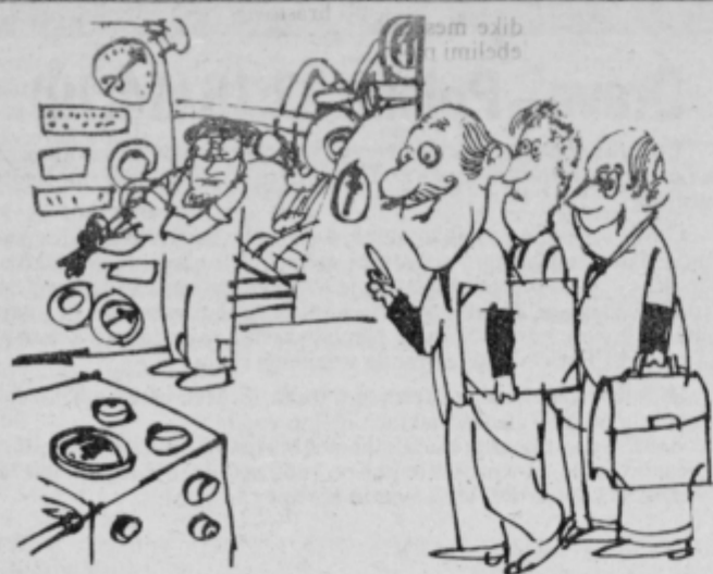
Ti kar pridno delaj, mi trije pa gremo ustvarjat pravilnik o stimulativnejšem nagrazevanju.