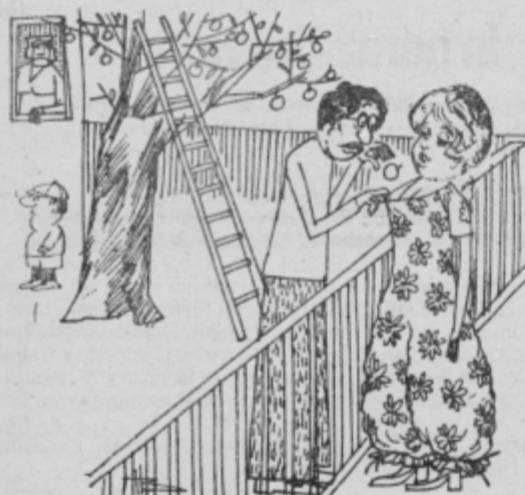
Oh, kako lepa jabolka so letos!