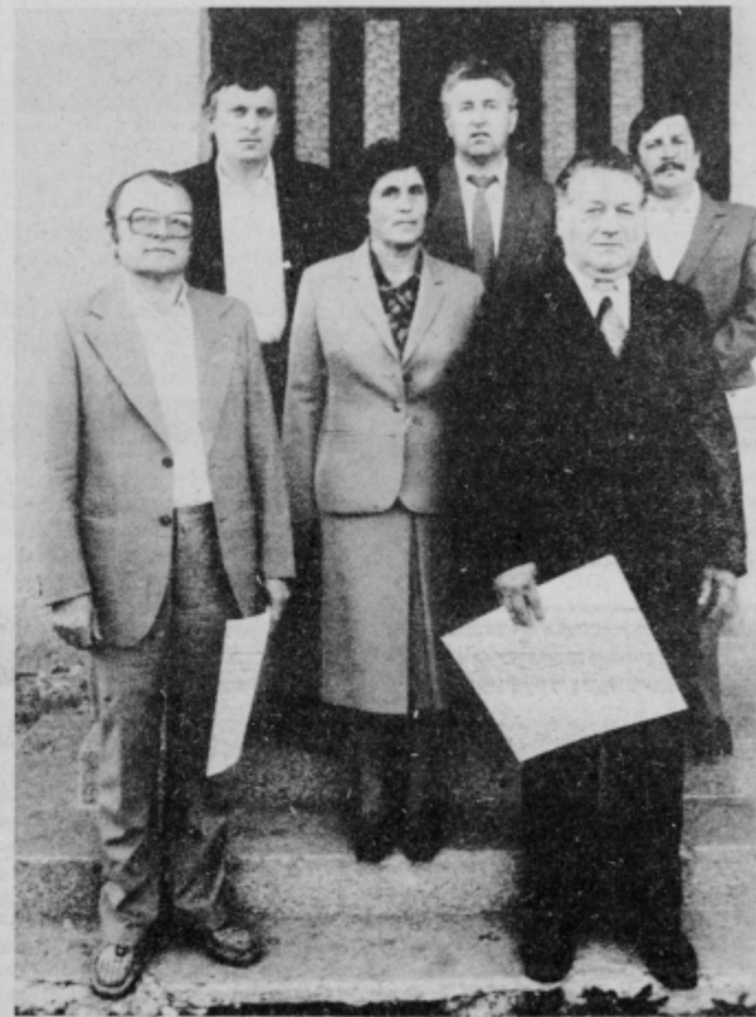
Prejemniki priznanj KS in bronastih znakov OF