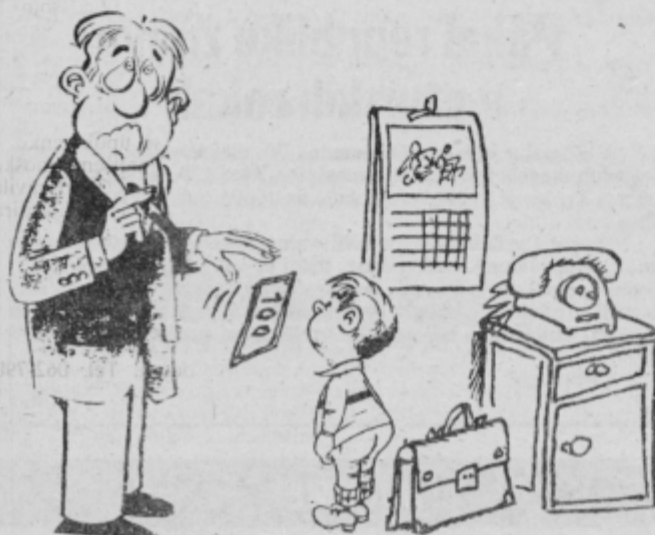
Ja očka, kako naj varčujem, če mi pa daješ tako malo žepnino!?