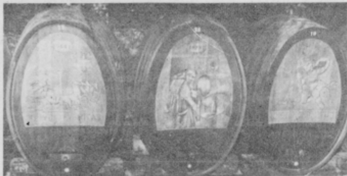
Sodi v kletih »Slovenskih goric« čakajo na novi pridelek