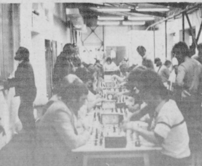
Borbena na turnirju