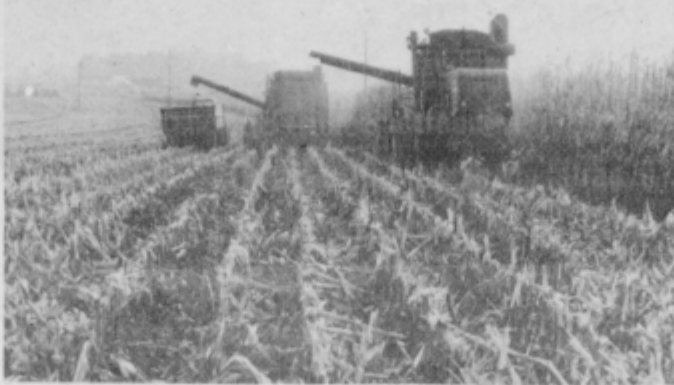
Pospravljanje koruze za silažo

Pri davčni politiki bi morali bolj ločiti tisto, kar kmet pridelava na lastni zemlji, krmo za prirejo mleka, mesa ipd. od tistega, kar ustvarja z industrijskimi krmili. Ob tem bi tudi morali dokončno opredeliti, kaj spada pod kmetij-