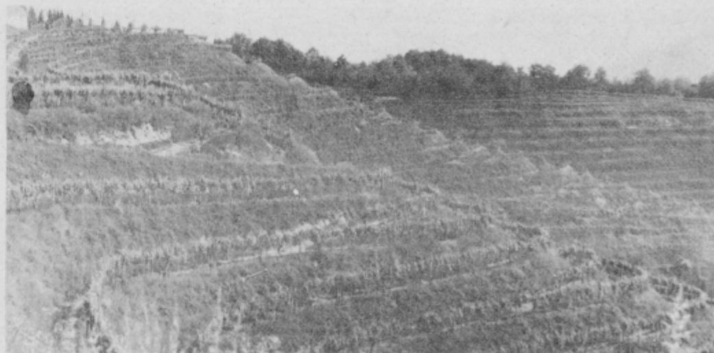
Toplo jesensko sonce je zadnje dni nekoliko dvignilo razpoloženje vinogradnikov