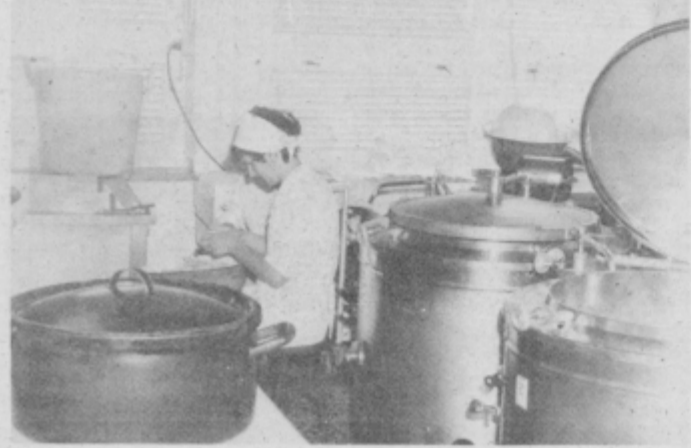
V tem majhnem prostoru pripravljajo prek 600 malic in do nedavna tudi 200 kosil, danes le še sto.

„Mi zajemamo območje, kjer imamo veliko interesentov za šolsko prehrano. Kljub temu, da smo si že leta prizadevali za sanacijo šolske kuhinje in jedilnice (te praktično nimamo), so bile v tem času še nekatere nujnejše investicije in nismo prišli na vrsto. Z začetkom letošnjega šolskega leta pa je dotrajanost nekaterih naprav tolikšna, da smo lahko prevzeli odgovornost za prehranjevanje le za okrog sto otrok iz prvih, drugih, tretjih in