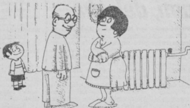
- Naša centralna se že ogreva ... - Saj se tudi drugod že začela kurilna sezona. - ... ne mislim tega, ogreva se za integracijo s KGP!