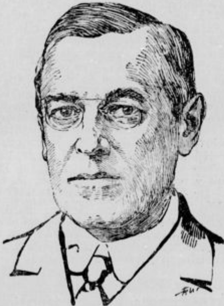
Novi predsednik Zedinjenih držav v Severni Ameriki profesor Wilson.