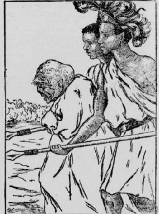
V nekoliko minutah je prišla v spremstvu dveh stražnikov, katera je med potom preklinjala.

»Dobro. Vesel sem, da najdem pot, kako s teboj govoriti. Jutri pojdeš z Infadusom in mojimi belimi brati na oni kraj in gorje ti, ako ne storiš tega;