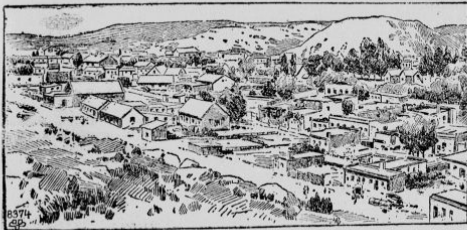
Pogled na Čataldžo.

Ko so se Turki umaknili iz bojev pri Lüle Burgasu proti Čorlu, so jih Bulgari hitro zasledovali. Vendar so se na črti