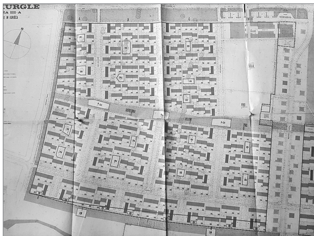
Slika 4: Grafični izsek kaže načrtovanje soseske Murgle. Vidna je razdelitev v posamezne kareje, razmejene z zelenimi pasovi in prometnicami. V vsakem od karejev so predvidene še notranje zelenice (vir: Odlok o sprejemu zazidalnega načrta za območje zazidalnega otoka VS-103 III. faza A – Murgle, Ur. l. SRS, št. 20/75).

seske je bilo že prvotno načrtovano središče z oskrbnimi in storitvenimi dejavnostmi. Načrtovana je bila umestitev osnovne šole, preskrbe, otroških igrišč, rekreacijskih in športnih površin (Glasnik, št. 32/65; Ur. l. SRS, št. 28/68, 39/74, 20/75).