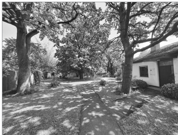
Slika 5: Notranja zelenica v Murglah, ki jo stanovalci sosesstva vzdržujejo in uporabljajo skupaj

Po normativih je bilo treba predvideti 2,5 m 2 površin/osebo za interne zelene površine in igrišča, 6,0 m 2 /osebo za rekreacijske površine in 3,0 m 2 /osebo za športne površine. Prostorski akti predvidevajo umestitev igrišč za majhne otroke v okviru stanovanjskih karejev, da je razdalja med domom in igriščem čim krajša in pot čim manj nevarna. Pri umestitvi igrišč so izbrane zlasti lokacije z obstoječim drevjem, ki se v celoti ohranja. Igrišča za večje otroke so umeščena v osrednjem zelenem pasu. Športne površine, tudi igrišča za igre z žogo, so umeščena ob Malem grabnu. Osrednja zelenica, ki poteka od vzhoda proti zahodu po vsej dolžini naselja, nudi zadostne rekreacijske površine za vse prebivalce. Ob omenjenih so v sosesko umeščene še parkovne zelenice v stanovanjskih karejih med posameznimi vrstami hiš.