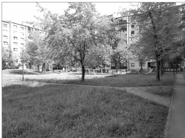
Slika 3: Notranja zelenica v podkvasti zazidavi na Beblerjevem trgu

otroška igrišča so primerno opremljena in vzdrževana, očitno se redno uporabljajo (Plazar, 2021). Sosesko prečka tudi Pot (nekdanja pot spominov in tovarištva), ki kot pešpot in zelen rekreacijski obroč poveže med seboj vse dele mesta.