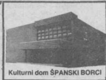
Kulturni dom ŠPANSKI BORCI

Tema vsekakor nudi obilo možnosti tako za zabavne kot