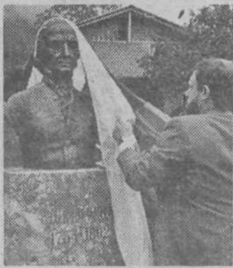
ski (na sliki) in ga izročil v varstvo krajanom KS Klopce.