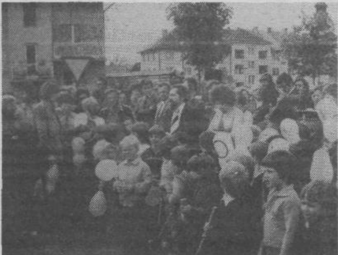
Poročali smo že, da je bil sredi maja odprt drugi vzgojno-varstveni zavod v naši soseski. To pot objavljamo sliko z odprtja. Mlado in staro se je razveselilo novega vrta, saj so z njim omiljene težave, ki na tem področju pestijo našo sosesko.