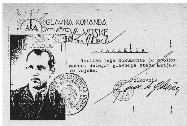
Fotokopija primera izkaznice z Glušičevim podpisom za vstop v glavni štab Matjaževe vojske.

roženih križarjev, je te imenovala »ilegalne bande« in se z vso resnostjo lotila organiziranja uničenja novega sovražnika.