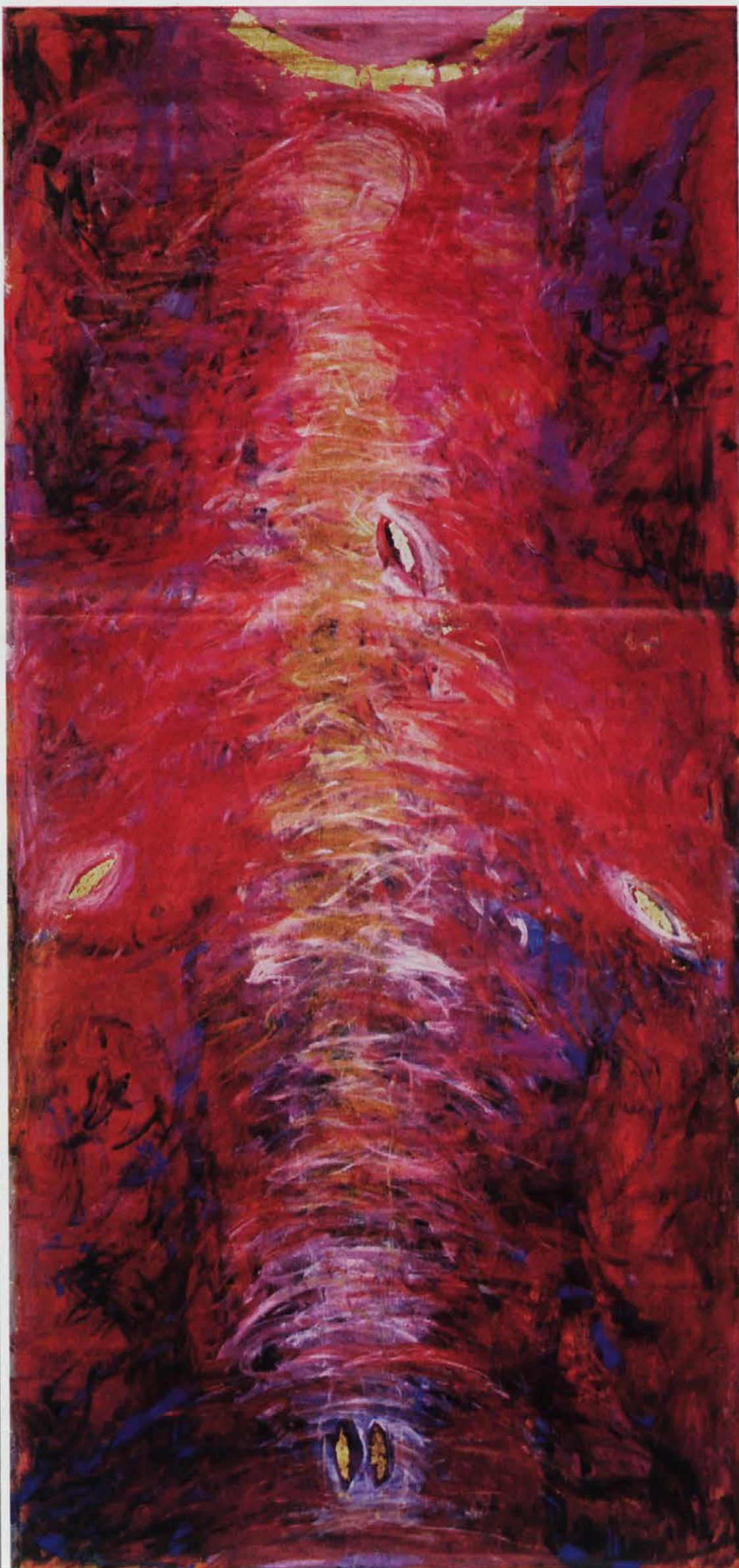
Mira Ličen Krmpotič, Vstali, akril na platnu, 450 x 200 cm, 2003