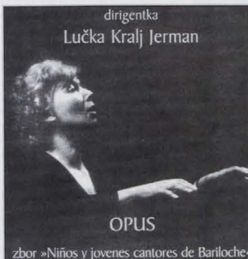
zbor »Niños y jóvenes cantores de Bariloche«

Mohorjeva družba iz Celja je torej opravila pomembno kulturno dejanje z izdajo zbirke Opus , ki jo sestavljata dve zgoščenki z arhivskimi posnetki tega zbora. Prva nosi naslov Patagonski glasovi v Evropi in na njem je zbran program, ki so ga izvajali med evropsko turnejo. Bil je februar leta 1982, ko so obiskali Švico, Nemčijo, Italijo, Vatikan in tudi Gorico. Kakšne so bile tedaj razmere in s kakšnimi občutki je dirigentka prišla v svoje rojstno mesto, smo lahko razumeli, ko je povedala, da so ob tisti priložnosti pevce slovenskega rodu pospremili v Števerjan, da so si lahko vsaj od daleč in preko meje ogledali, kako se kaže domovina njihovih očetov in dedov - Slovenija. Kdor se je udeležil tega goriškega nastopa, gotovo ohranja najlepši spomin na njihov nastop,