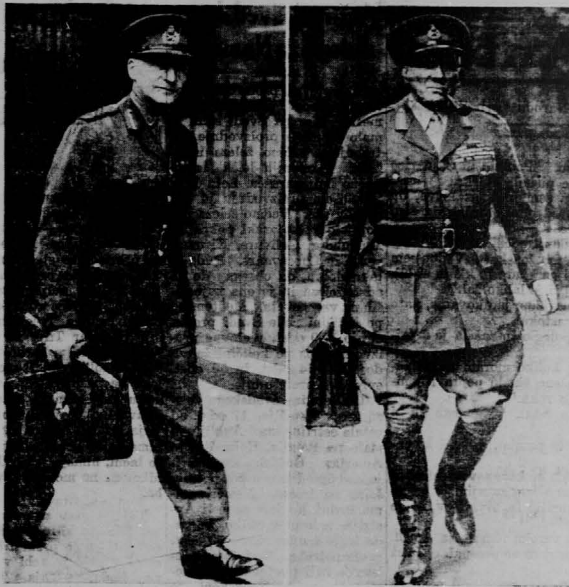
General sir John G. Dill, ki je bil imenovan za novega šefa angleškega generalnega štaba in general sir Edmund Ironside, ki je bil poklican s fronte v Anglijo, da prevzame vrhovno poveljstvo za obrambo dežele.