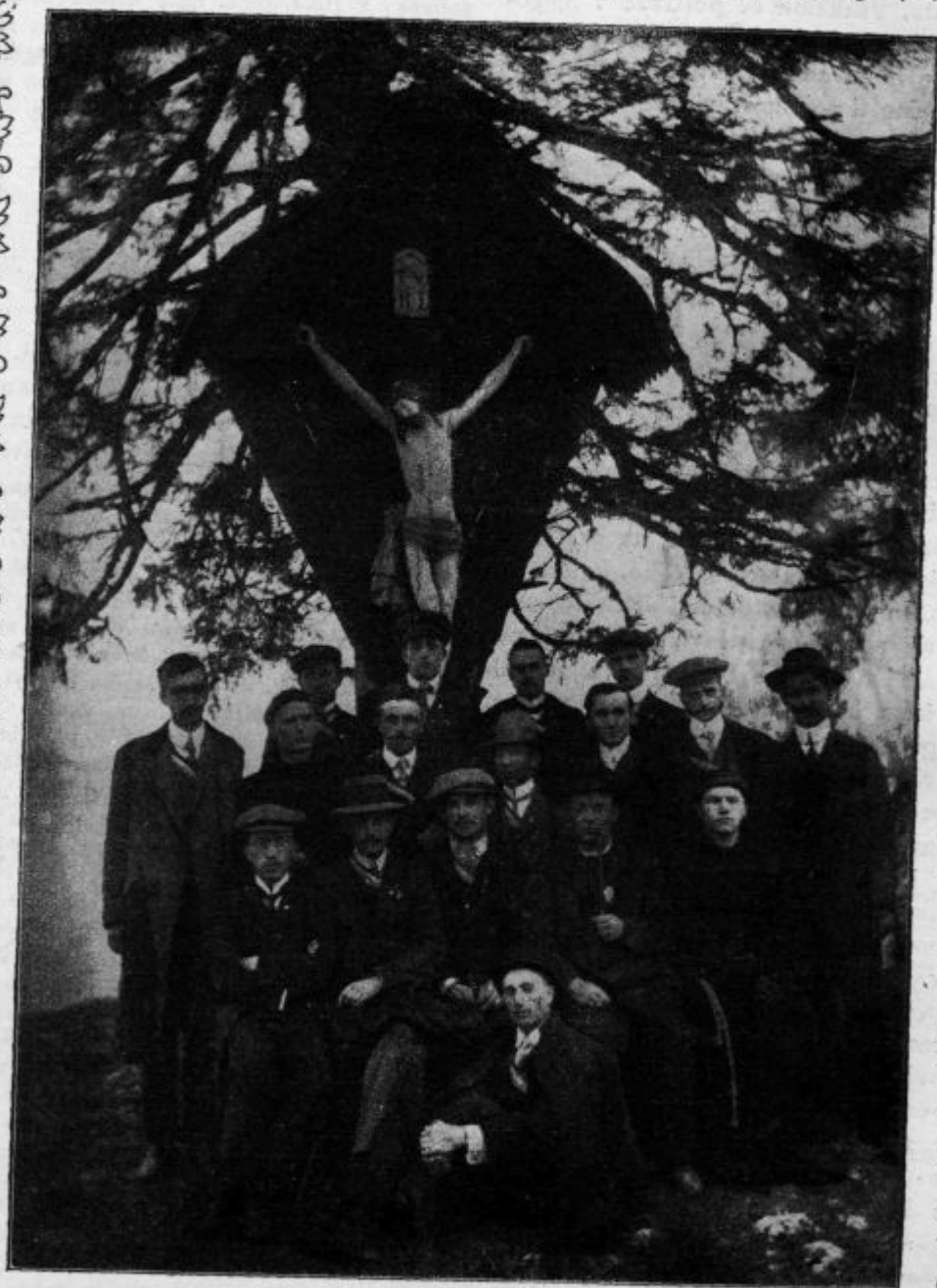
Dr. Janez Krek s hrvaškimi katoliškimi visokošolci, Domagojci, pri poučnem tečaju na gori sv. Jošta pri Kranju.