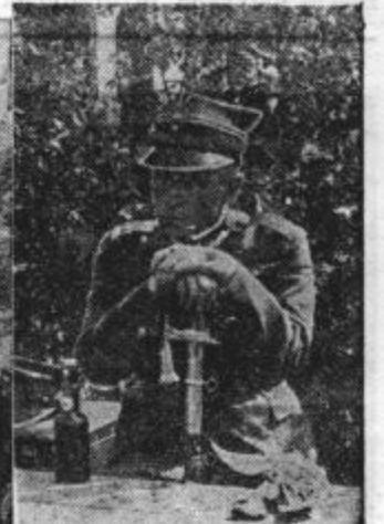
Prizori iz vojnega vrveža (od leve na desno): Francoski vojaki v novi bojni opremljeni. — Poljska posadka z znamenite Westerplatte, ki se je borila z nepopisno hrabrostjo in se je predala po dolgih bojih šele po treh dneh lakote. V priznanje za hrabrost posadke so Nemci poveljniku tudi po predaji dovolili nositi sabljo. — Poveljnik poljske posadke na Westerplatte.