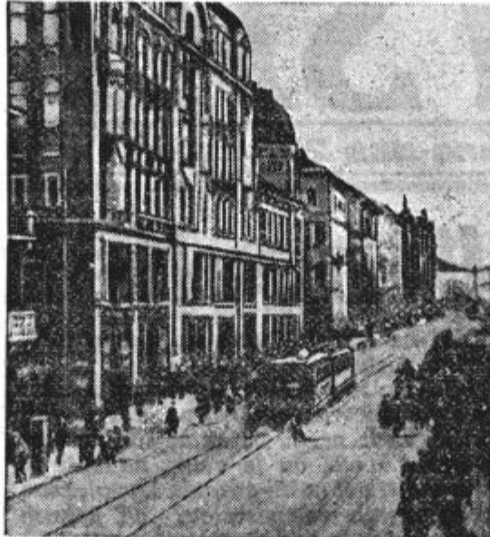
Ulica v Lo d Ź u, mestu, ki je imelo za Poljsko velik industrijski pomen.

Prav ta primer živo dokazuje, kako ničev je sistem bilateralnih (dvostranskih) pogodb, kakor hitro je pokopano načelo kolektivne var-