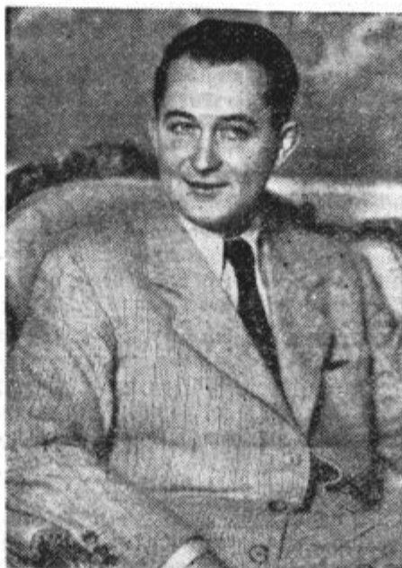
Dr. Šubašić, prvi ban banovine Hrvatske po narodnem sporazumu.